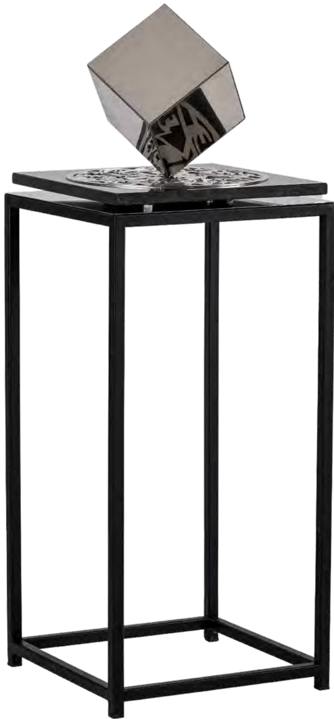
Υλη - Χώρος - Χρόνος μικτή τεχνική 115x40x40