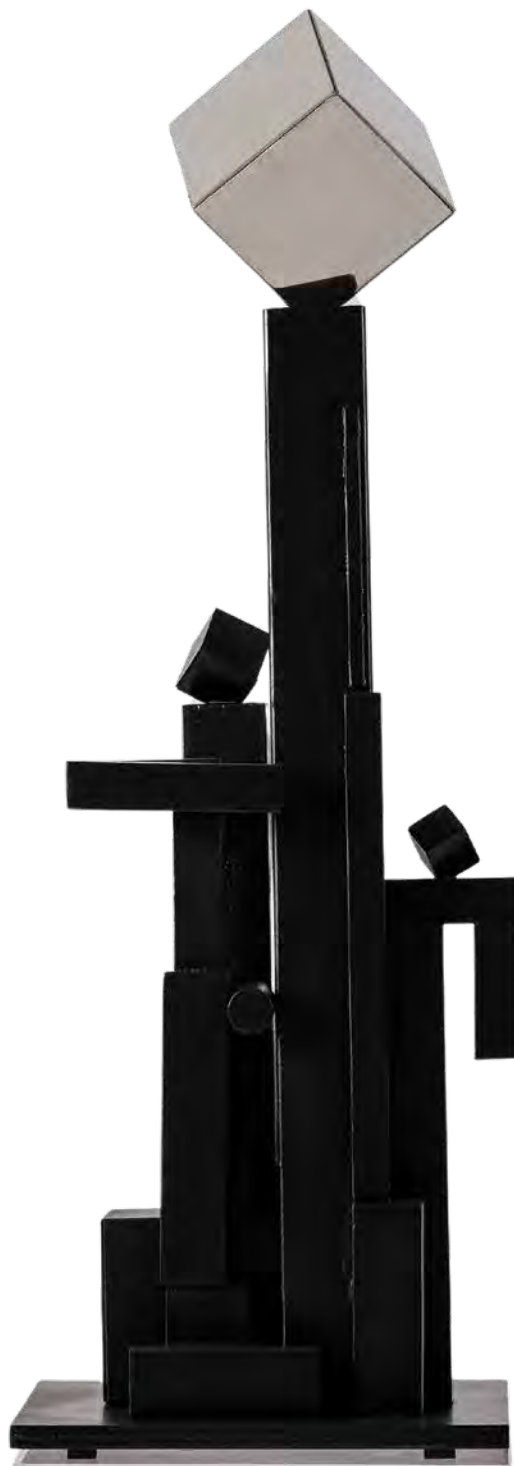
Αφιέρωμα στον Αναξαγόρα μικτή τεχνική 130x42x42