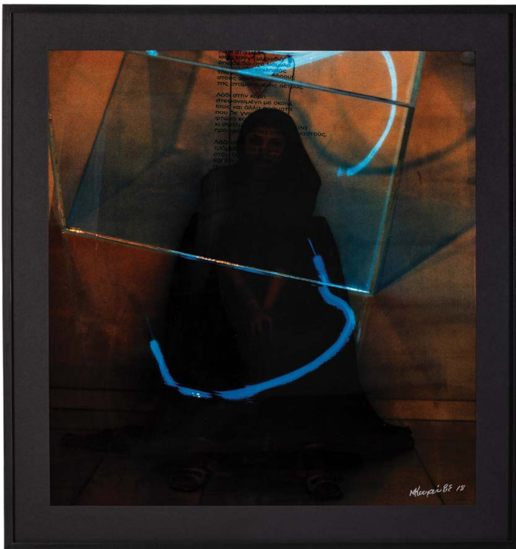
Ιερά Πορνεία Β' μικτή τεχνική 83x90