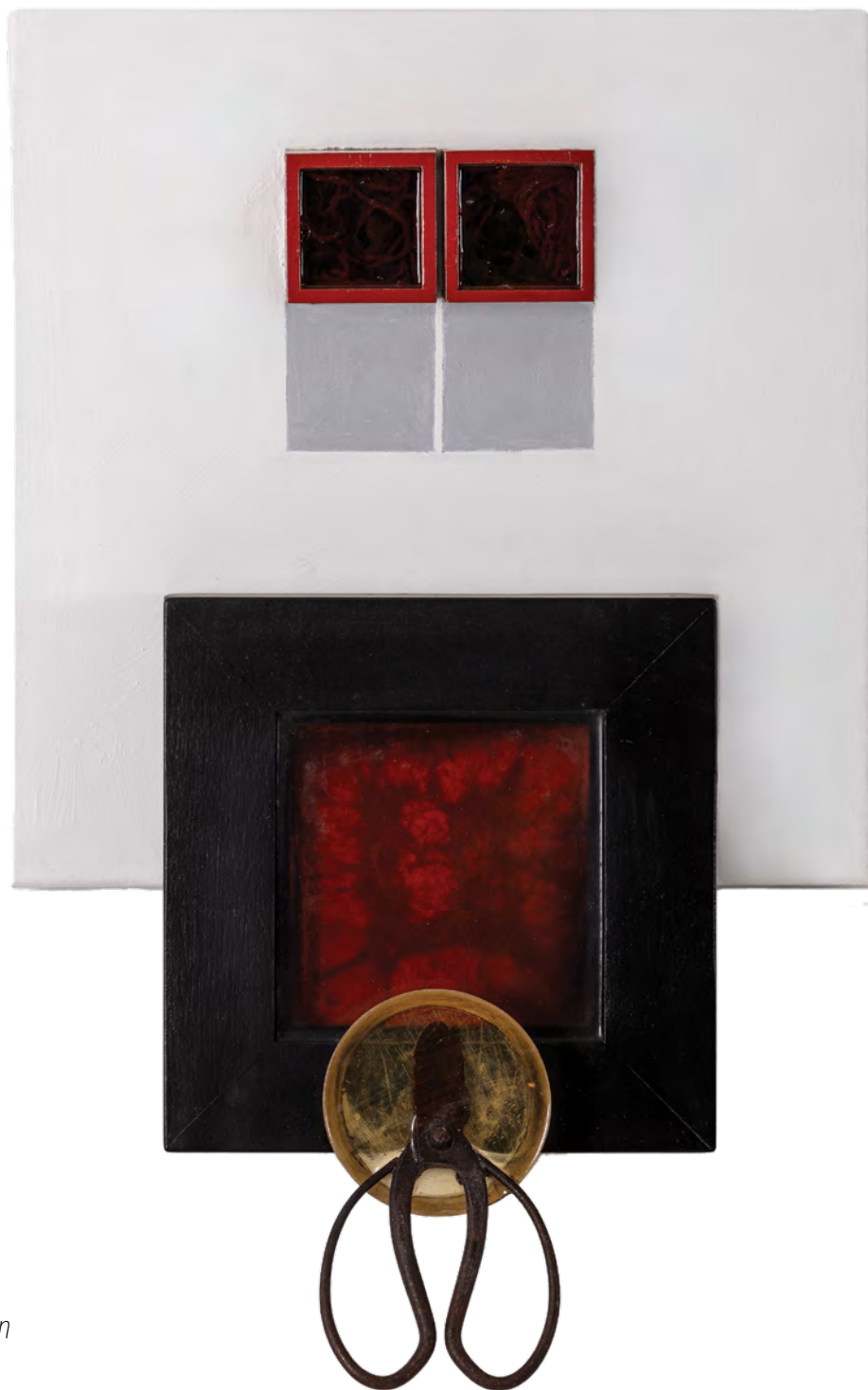
Αφιέρωμα στον Αριστοτέλη μικτή τεχνική 64x40x15