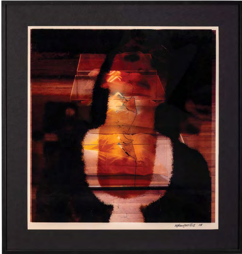
Ιερά Πορνεία Α' μικτή τεχνική 80x84