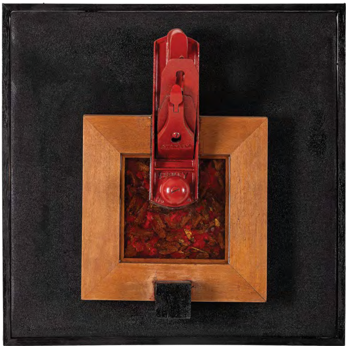
Αφιέρωμα στον Θαλή τον Μιλήσιο μικτή τεχνική 48x48x20