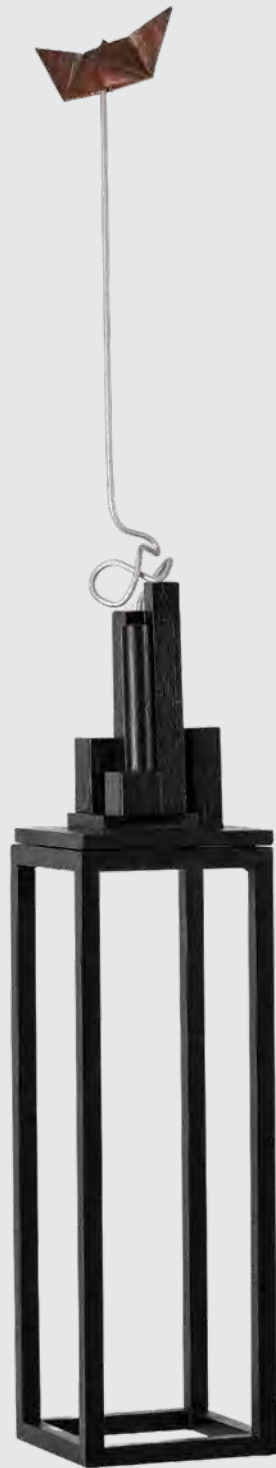
Υπερβατικό Ταξίδι μικτή τεχνική 145x20x20