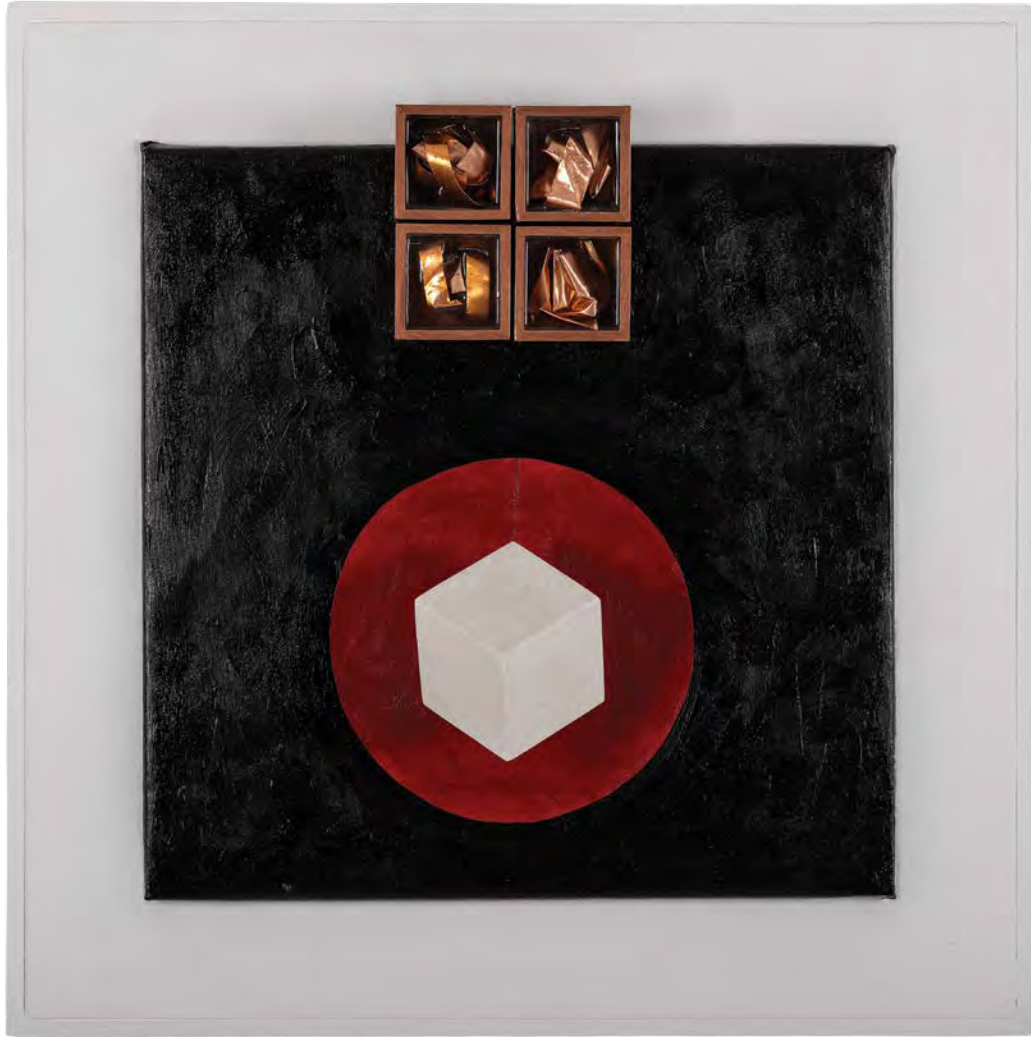
Αφιέρωμα στον Πλάτωνα μικτή τεχνική 62x62x18