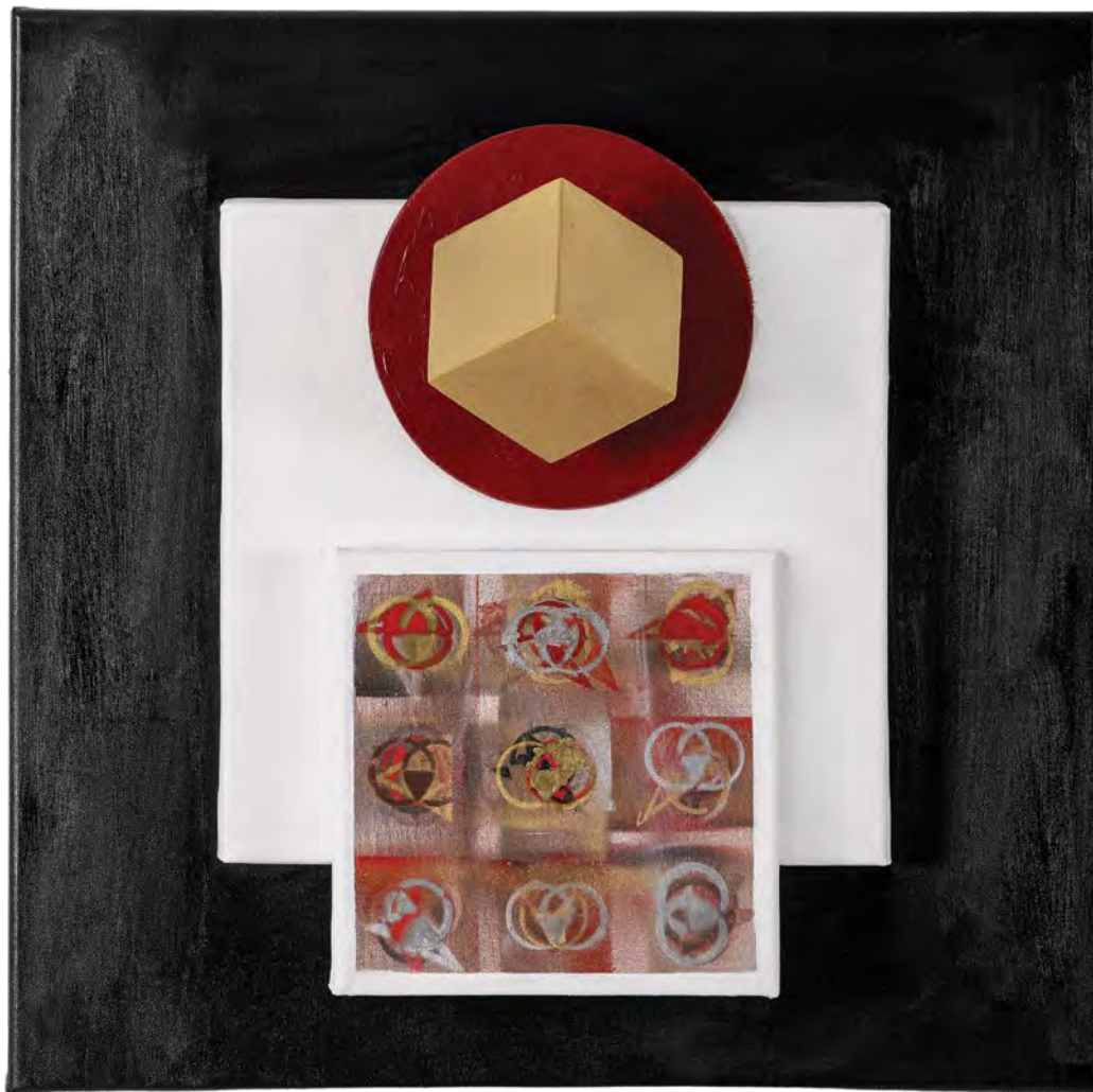
Αφιέρωμα στον Ηράκλειτο μικτή τεχνική 50x50x20