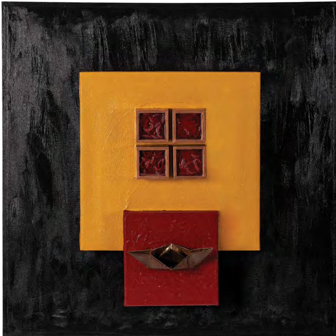
Αφιέρωμα στον Επίκουρο μικτή τεχνική 72x72x17