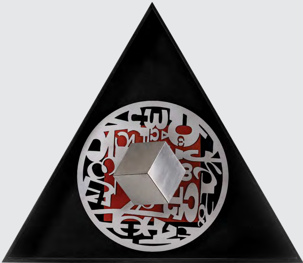
Αφιέρωμα στον Πυθαγόρα μικτή τεχνική 75x65x28