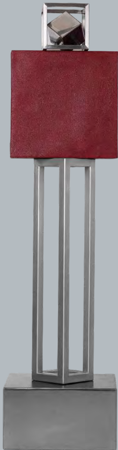
Νίκος Κουρούσης 'Υψηλός Χώρος Χρόνος