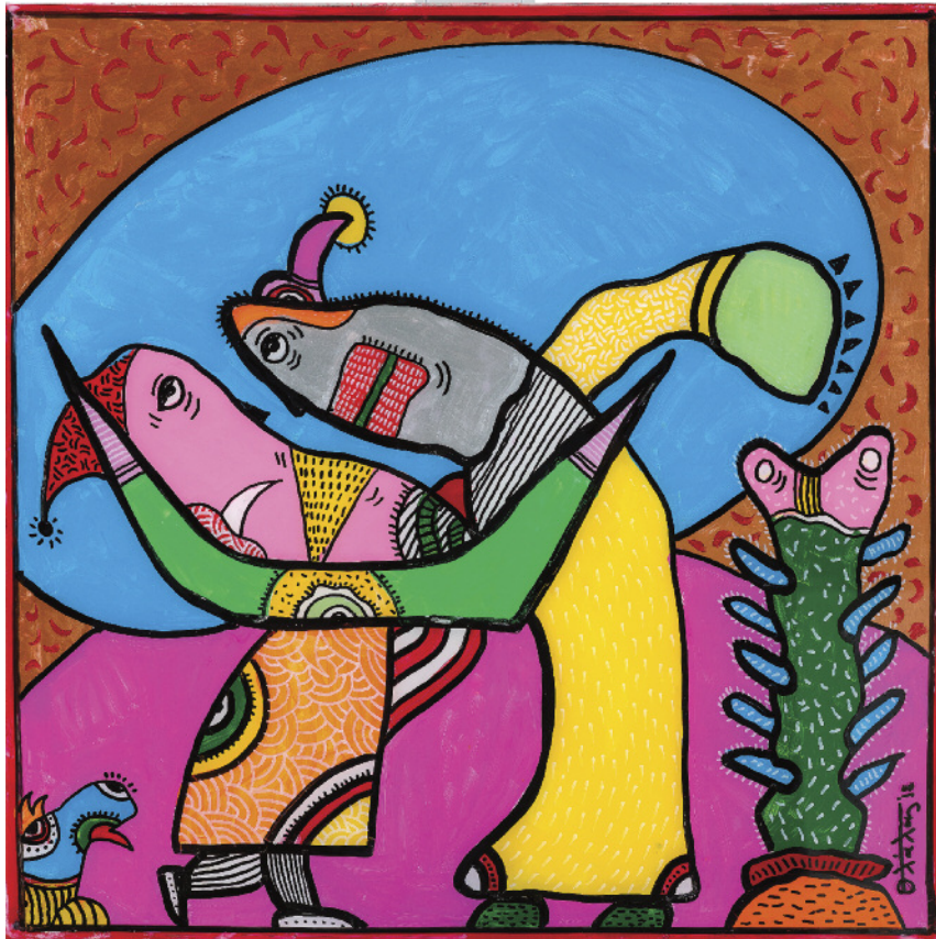
70x70 εκ., ακρυλικό σε πλέξι