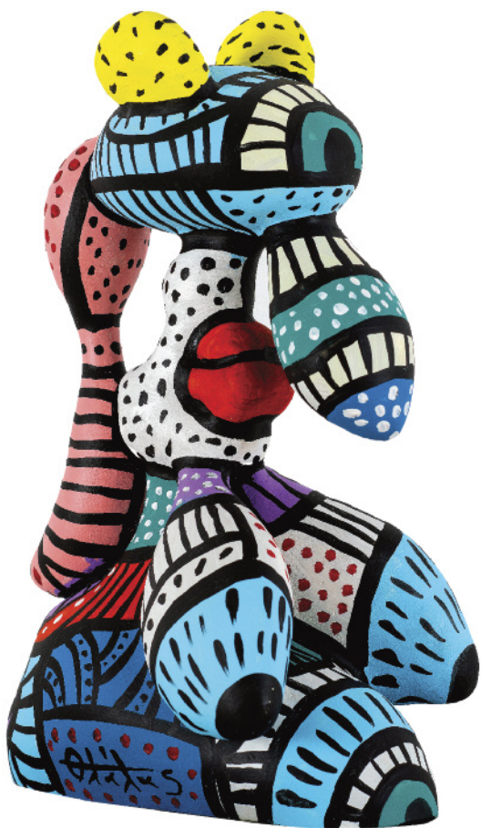
πολυεστέρας με ακρυλικά μοναδικό