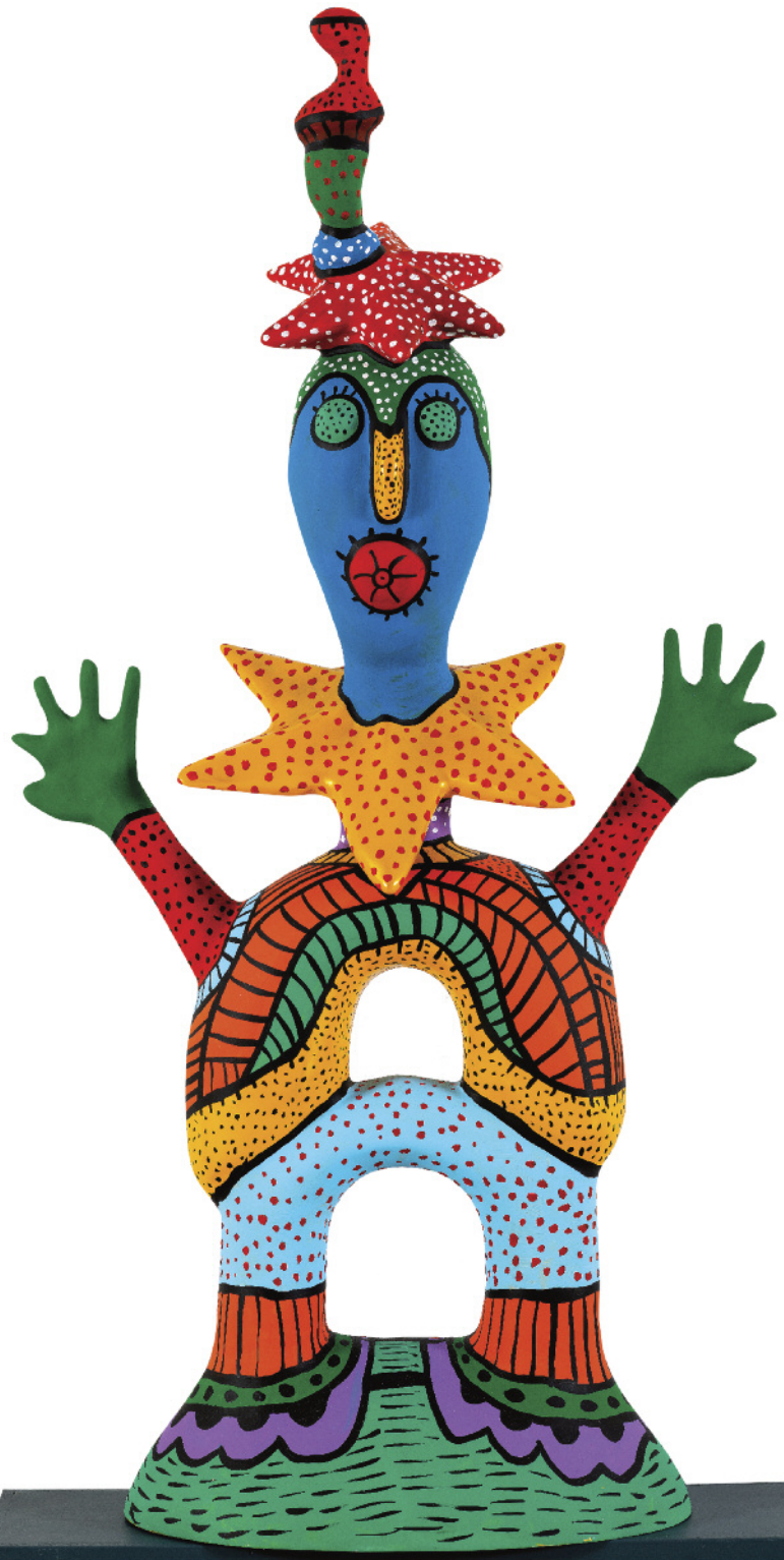
πολυεστέρας με ακρυλικά μοναδικό