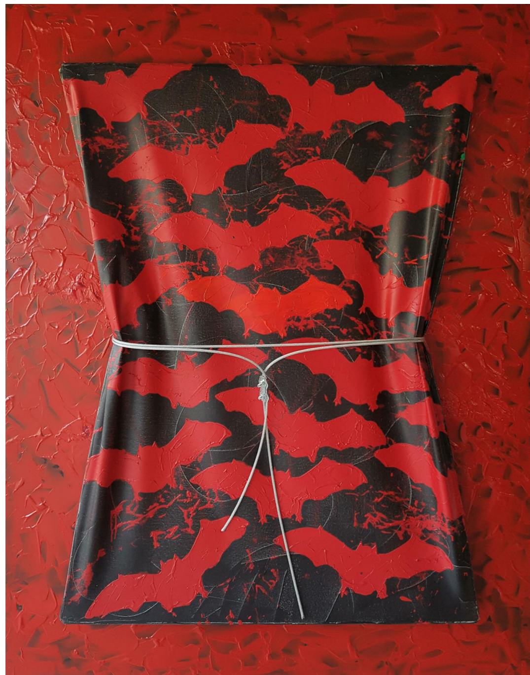
Τα Όνειρα μου Γεννούν Εικόνες IV (2016) • καμβάς, ξύλο, ακρυλικό, μέταλλο • 100x80 εκ.