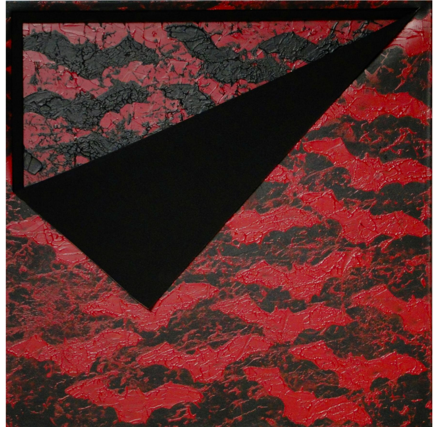
Χωρίς Τίτλο (2016) • καμβάς, ξύλο, ακρυλικό • 80x80 εκ.