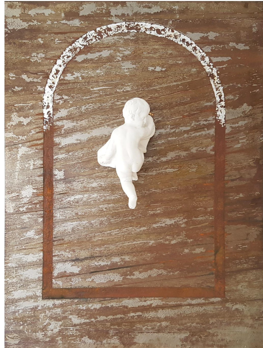
Beroxisme (2016) • μέταλλο, σκουριά, ασήμι, γύψος • 100x75 εκ.