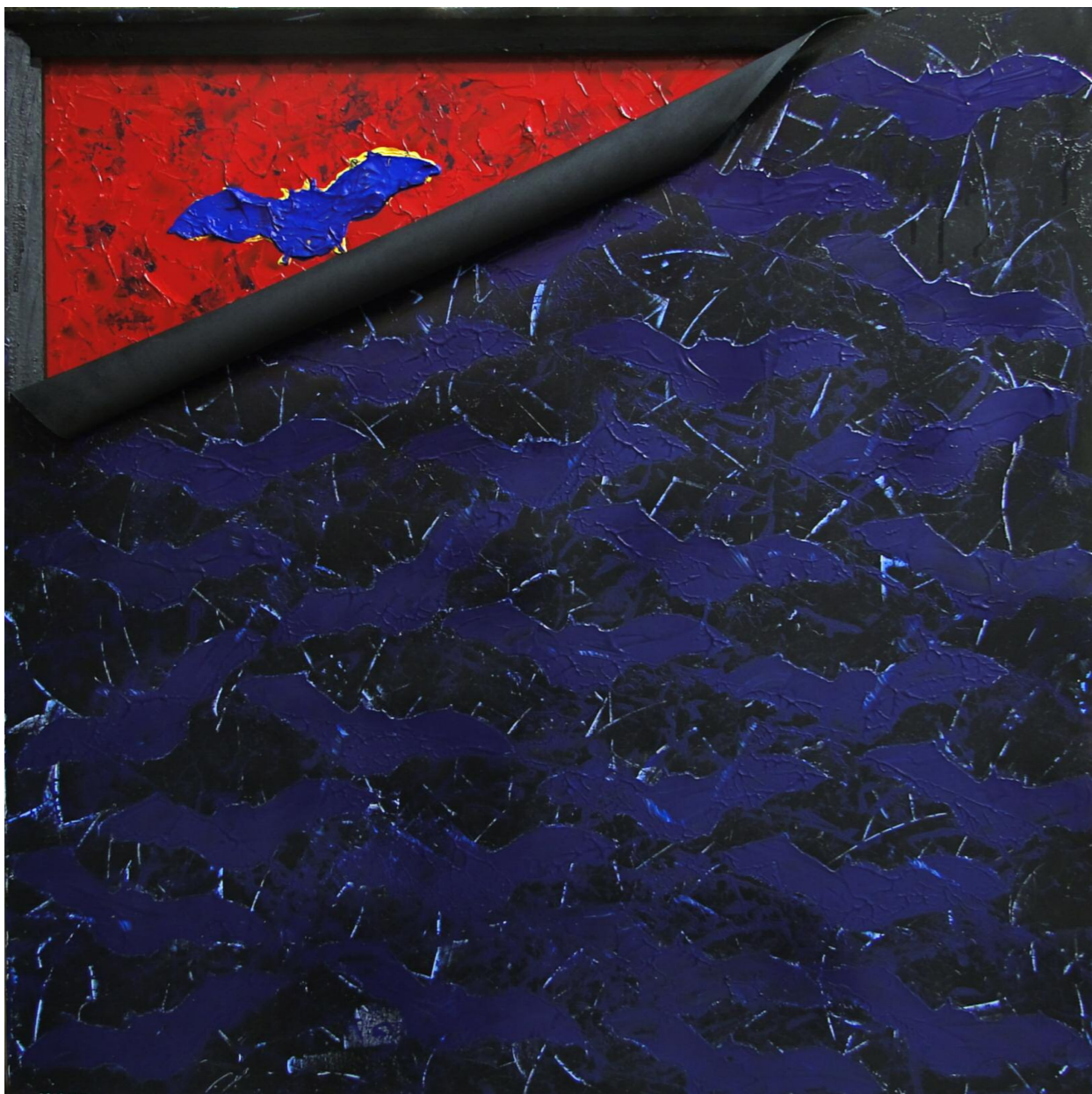
Τα Όνειρα μου Γεννούν Εικόνες I (2016) • καμβάς, ξύλο, ακρυλικό • 100x100 εκ.