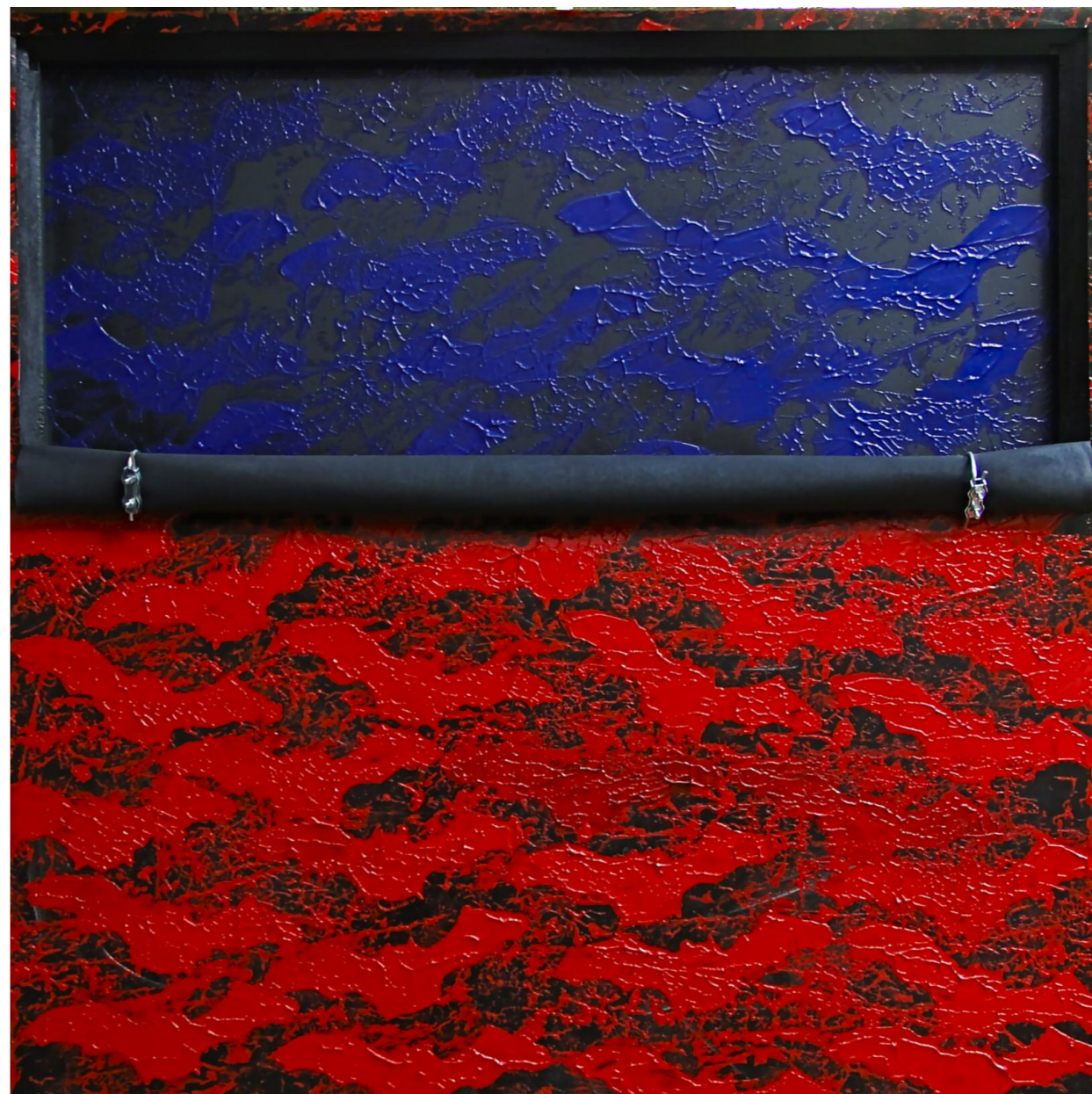
Τα Όνειρα μου Γεννούν Εικόνες II (2016) • καμβάς, ξύλο, ακρυλικό • 100x100 εκ.