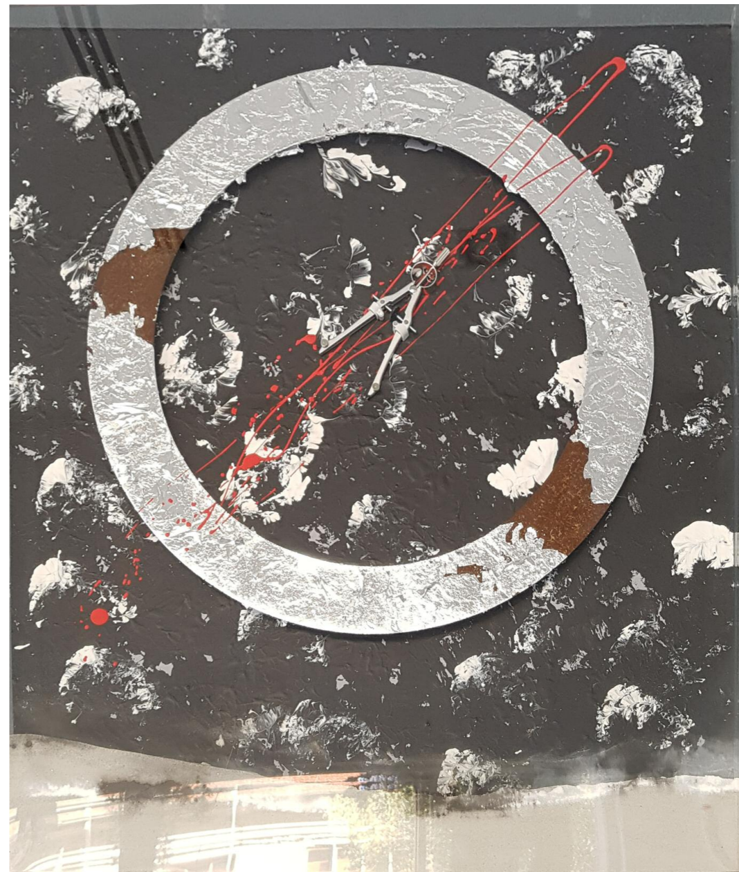
Χωρίς Τίτλο (2016) • μεικτά υλικά • 80x68 εκ.