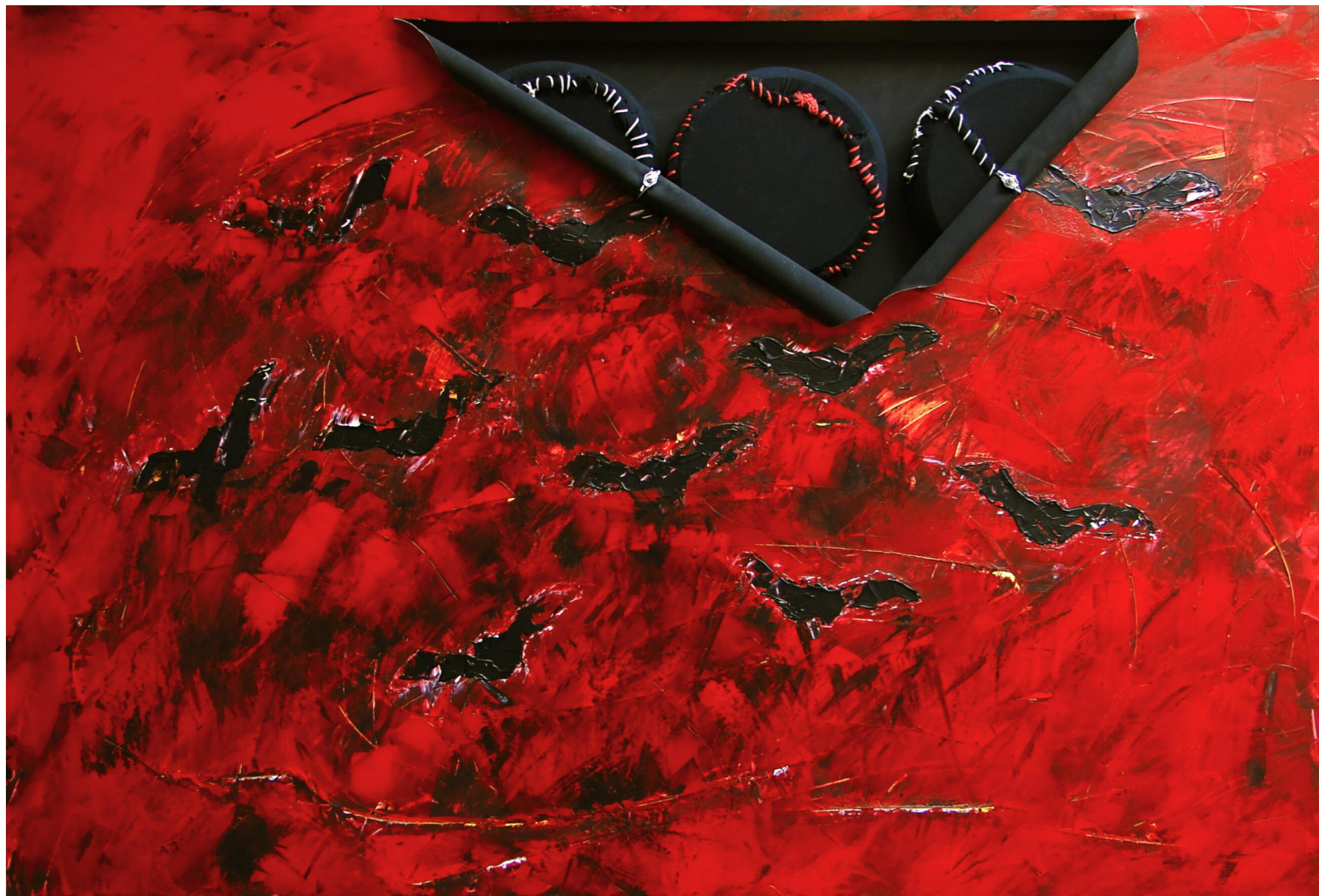
Τα Όνειρα μου Γενούν Εικόνες III (2016) καμβάς, ξύλο, ακρυλικό, ύφασμα, ρολόγια • 100x150 εκ.