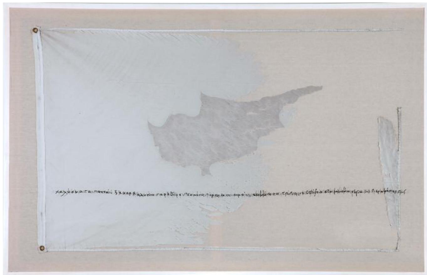
Λία Λαπίθη • Η Συνοδή της Κύπρου, (2015) • σημαία εφαρμοσμένη σε καμβά, βίντεο • 103x162 εκ.