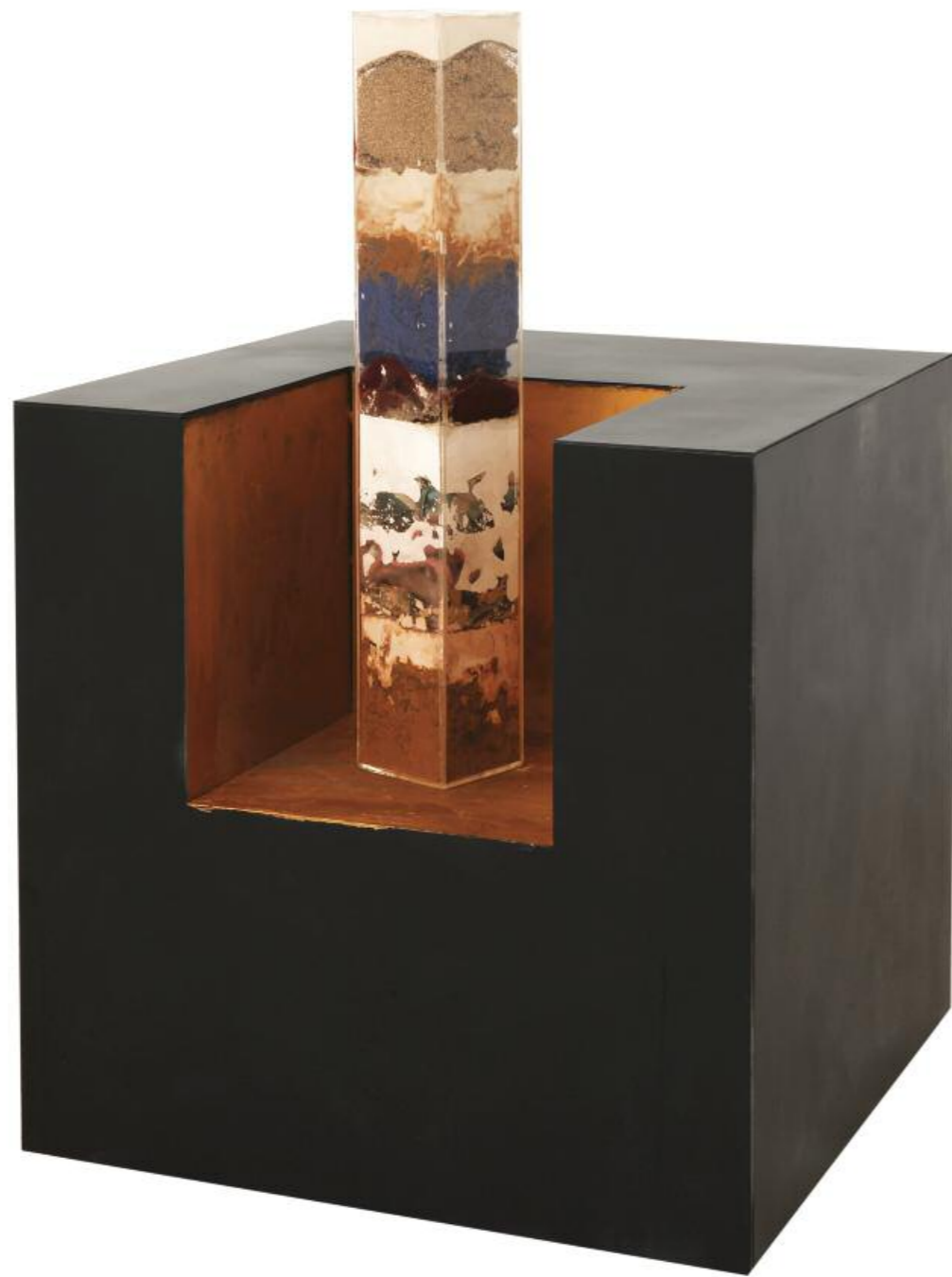
Νίκος Κουρούσις · Θρόνος, (2015) · μέταλλο, πλέξι, μικτά υλικά · 90x60x60 εκ.