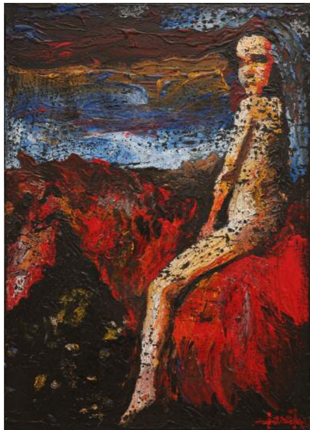
Κίκος Λανίτης · Χωρίς Τίτλο, (2015) μικτή τεχνική σε καμβά · 70x50 εκ.