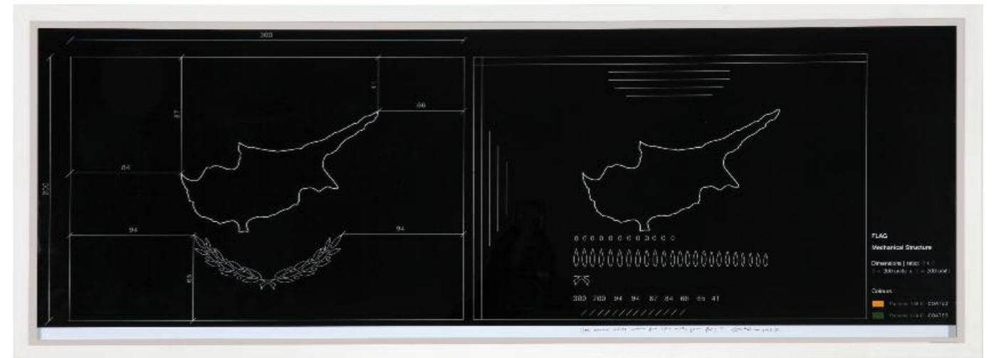
Λία Λαπίθη • How Many Olives Would You Like with your Flag? (2015) • 40x120 εκ.