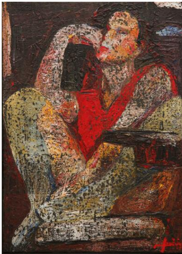
Κίκος Λανίτης · Χωρίς Τίτλο, (2015) μικτή τεχνική σε καμβά · 70x50 εκ.