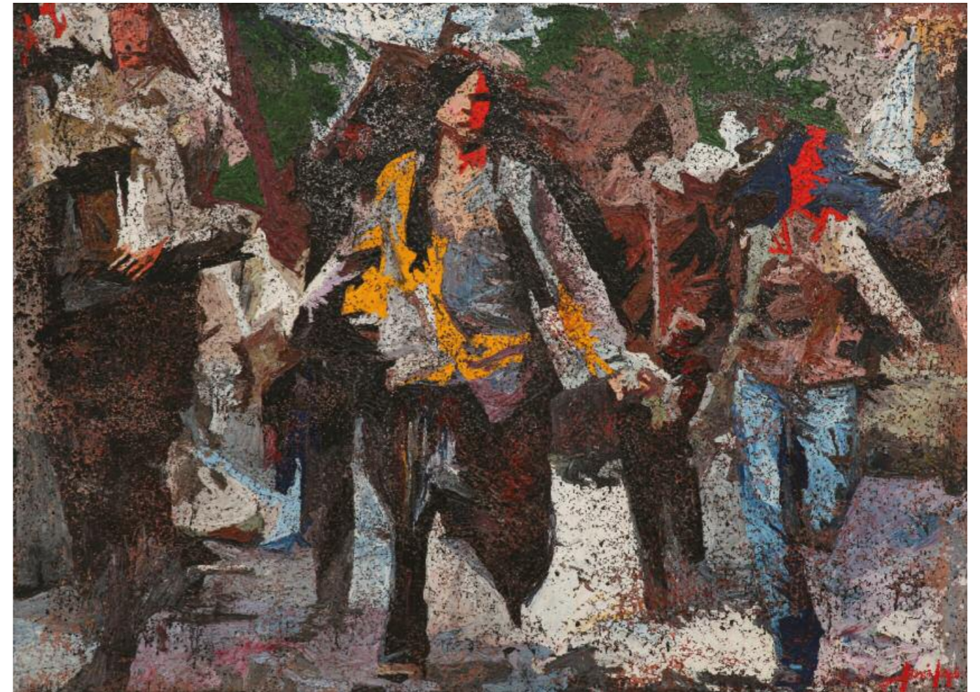
Κίκος Λανίτης · Χωρίς Τίτλο, (2015)· μικτή τεχνική σε καμβά · 110x150 εκ.