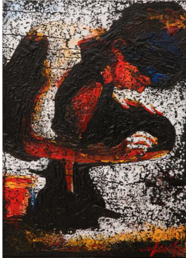
Κίκος Λανίτης · Χωρίς Τίτλο, (2015) μικτή τεχνική σε καμβά · 70x50 εκ.