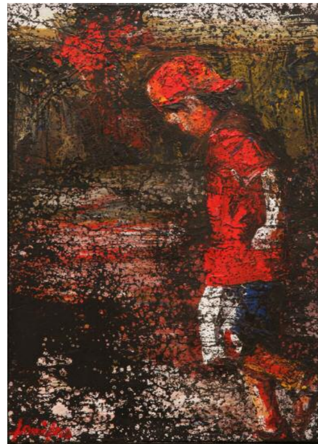
Κίκος Λανίτης · Χωρίς Τίτλο, (2015) μικτή τεχνική σε καμβά · 70x50 εκ.