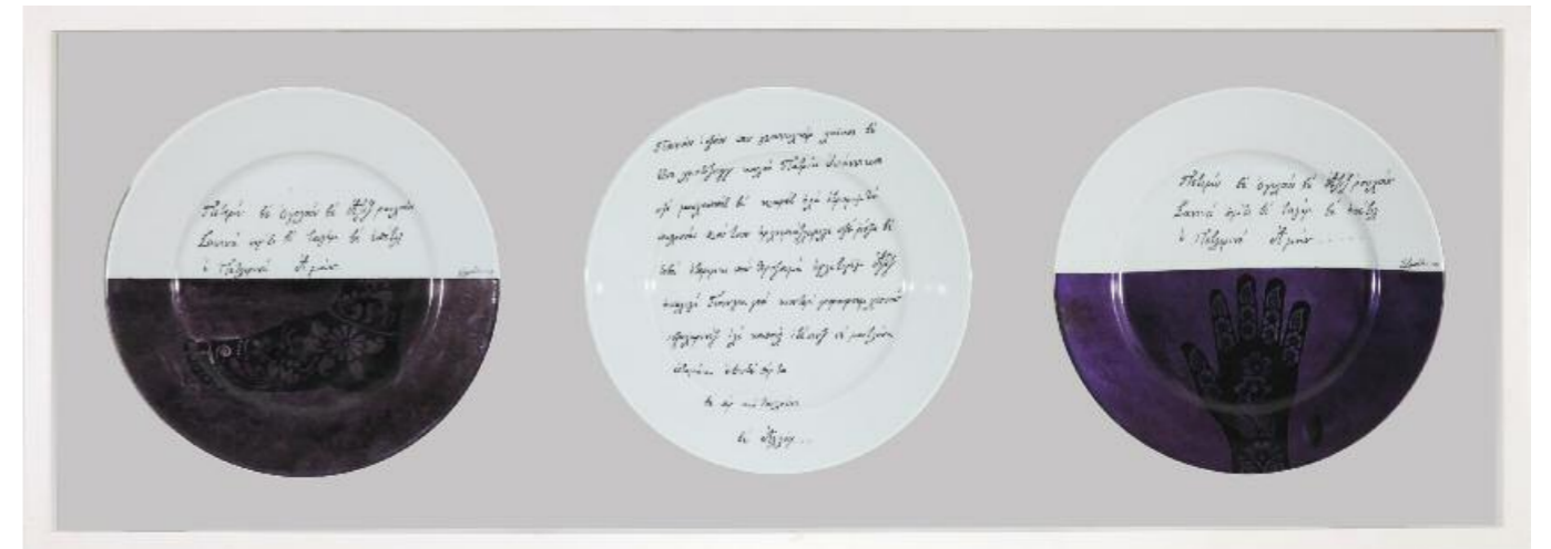
Λία Λαπίθη · Μικρασιάτικο Ημερολόγιο σε Καραμανλήδεια Γραφή, (2015) · 103x162 εκ.