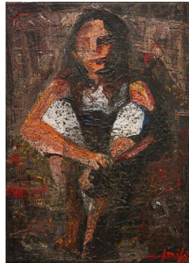
Κίκος Λανίτης · Χωρίς Τίτλο, (2015) μικτή τεχνική σε καμβά · 70x50 εκ.