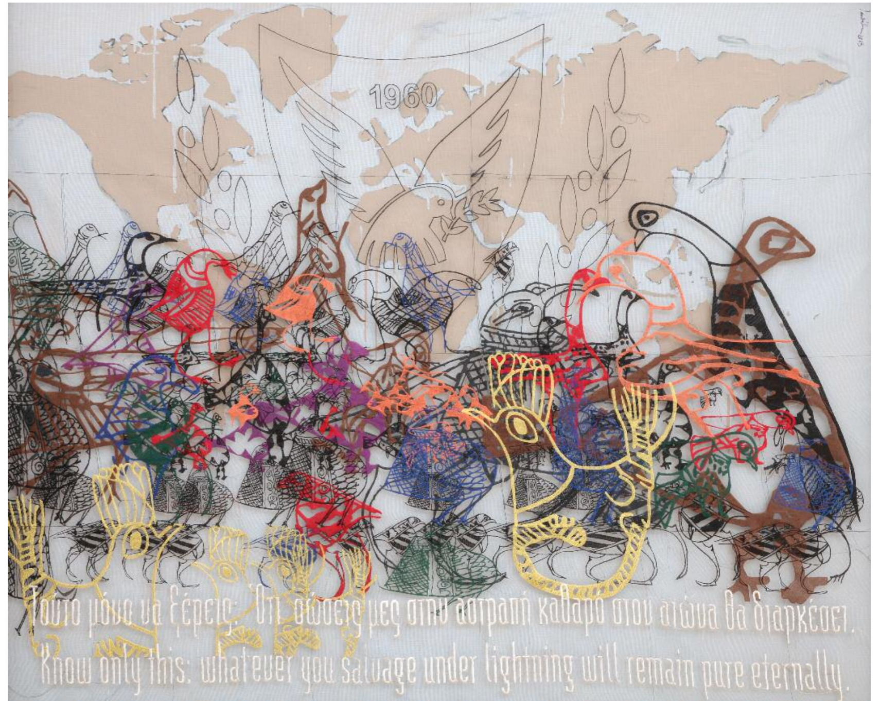
Λία Λαπίθη • Πουλί Πιασμένο στο Δίκτυ, (2015) • κεντυμένο πλέγμα, δίχτυ • 180x220 εκ.