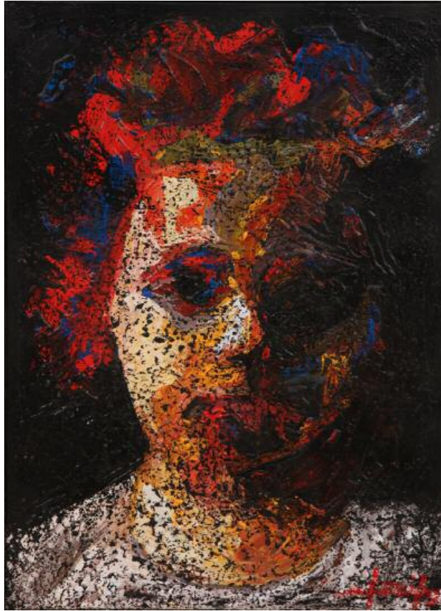
Κίκος Λανίτης · Χωρίς Τίτλο, (2015) μικτή τεχνική σε καμβά · 70x50 εκ.