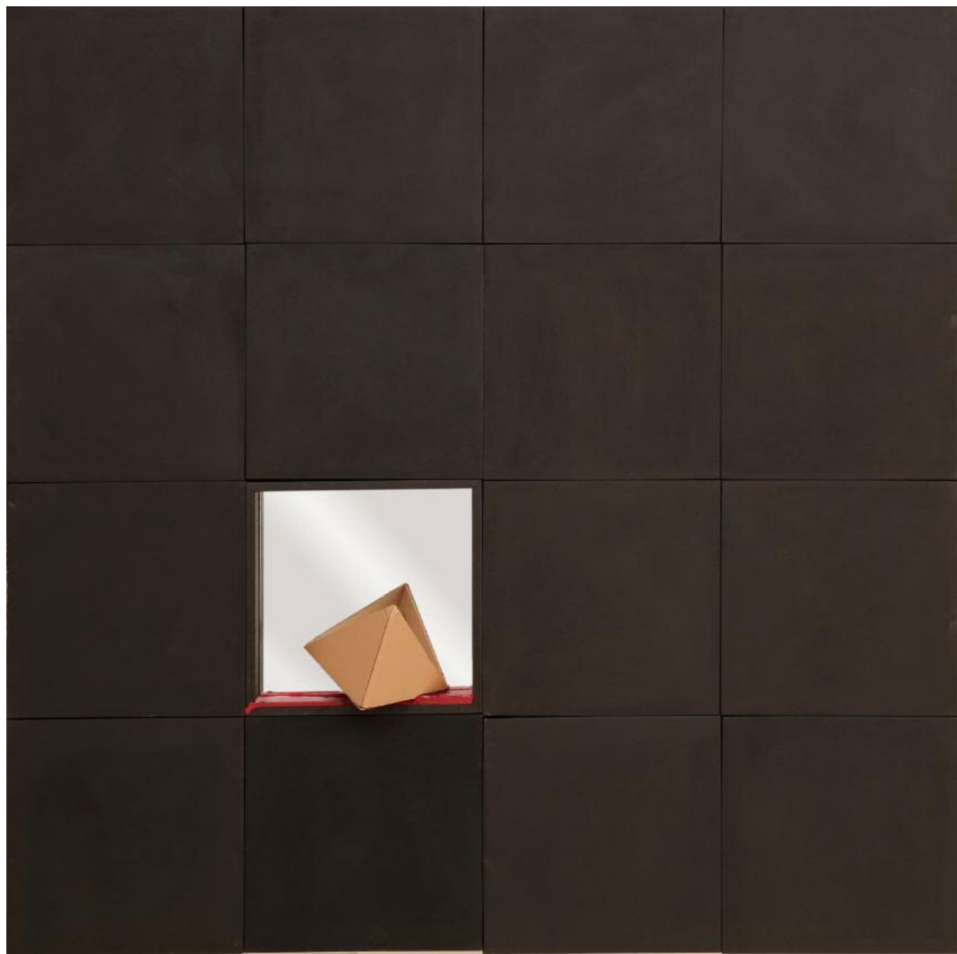
Νίκος Κουρούσις · Διασπορά, (2015) · καμβάς, γυαλί, κερί, χαρτόνι · 180x180 εκ.