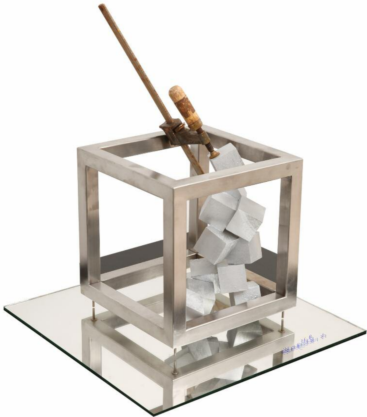
Νίκος Κουρούσις · Ανάπτυξη , (2015) · μικτά υλικά · 50x25x25 εκ.