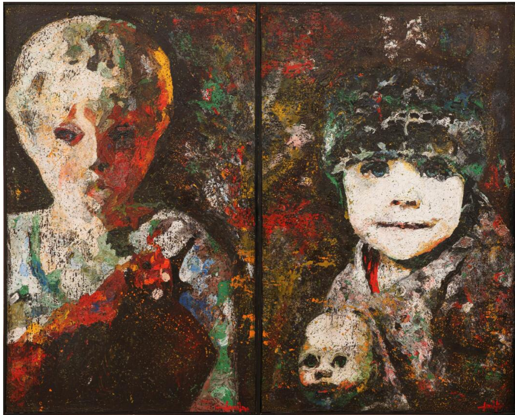
Κίκος Λανίτης · Μετακινήσεις II, (2015) · μικτή τεχνική σε καμβά · 180x110 εκ.