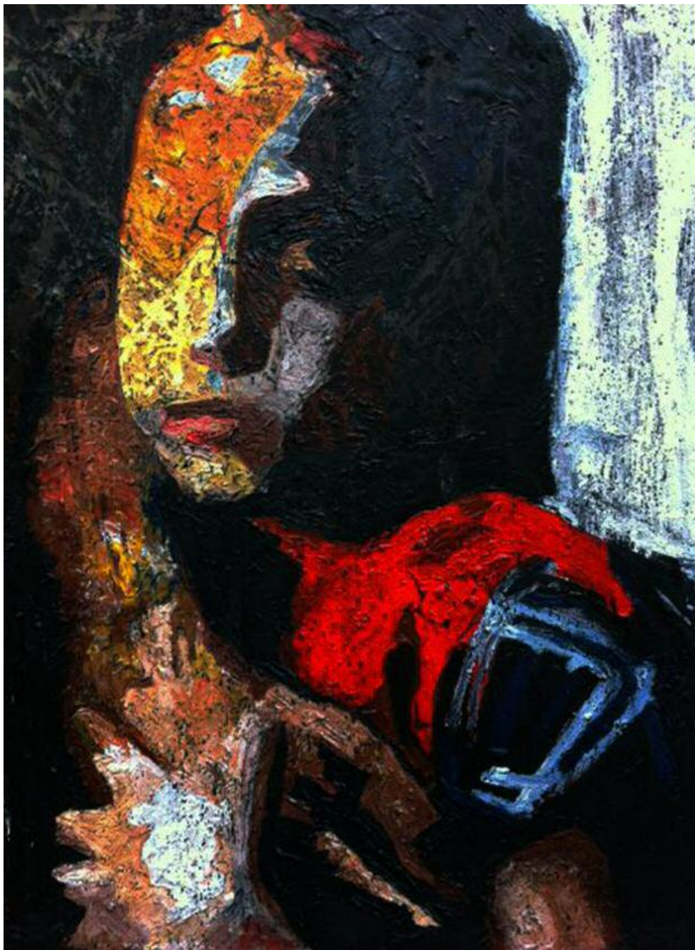
Κίκος Λανίτης · Χωρίς Τίτλο, (2015) · μικτή τεχνική σε καμβά · 150x110 εκ.