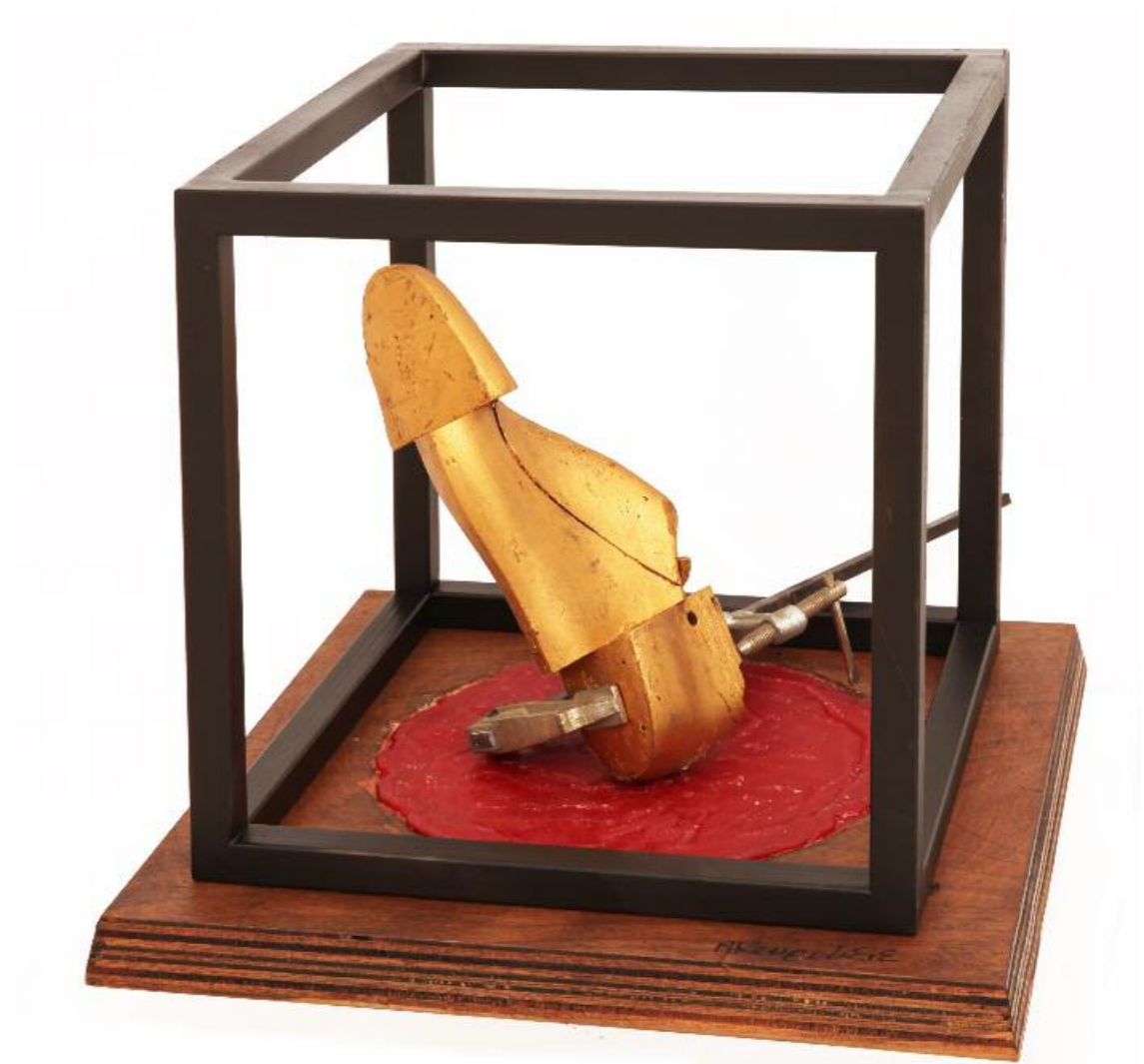
Νίκος Κουρούσις · Τριλογία , (2013) · μικτά υλικά · 45x40x40 εκ.