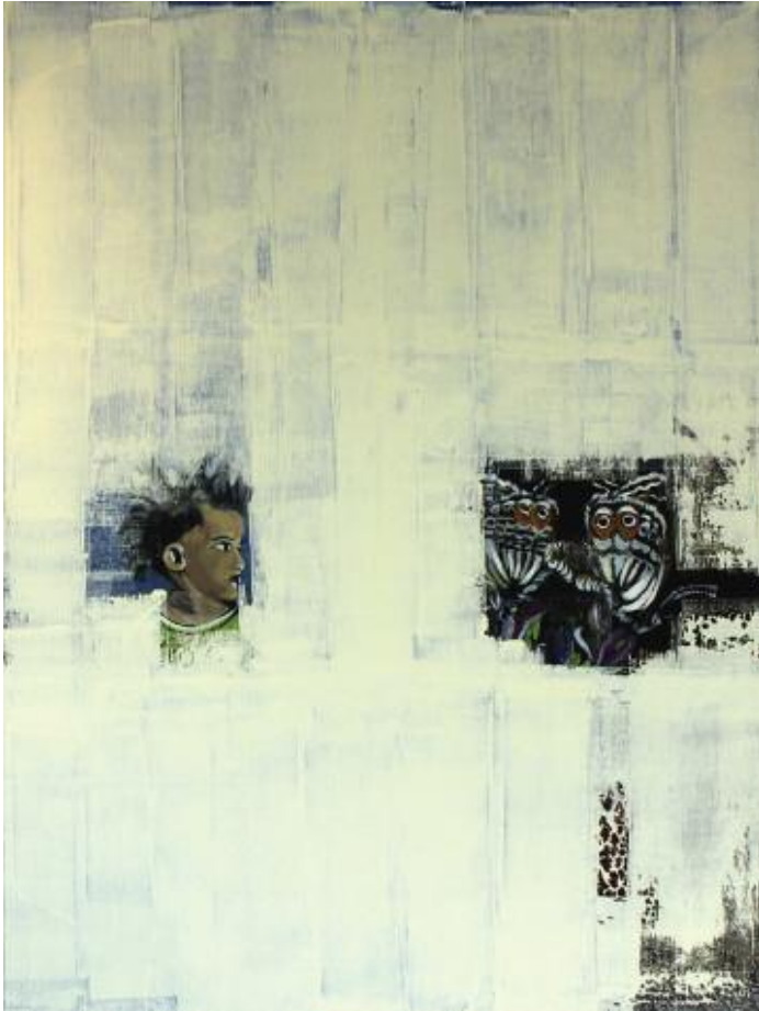
Opening into Spring Hormones 2015 122 x 92 cm, acrylic on canvas