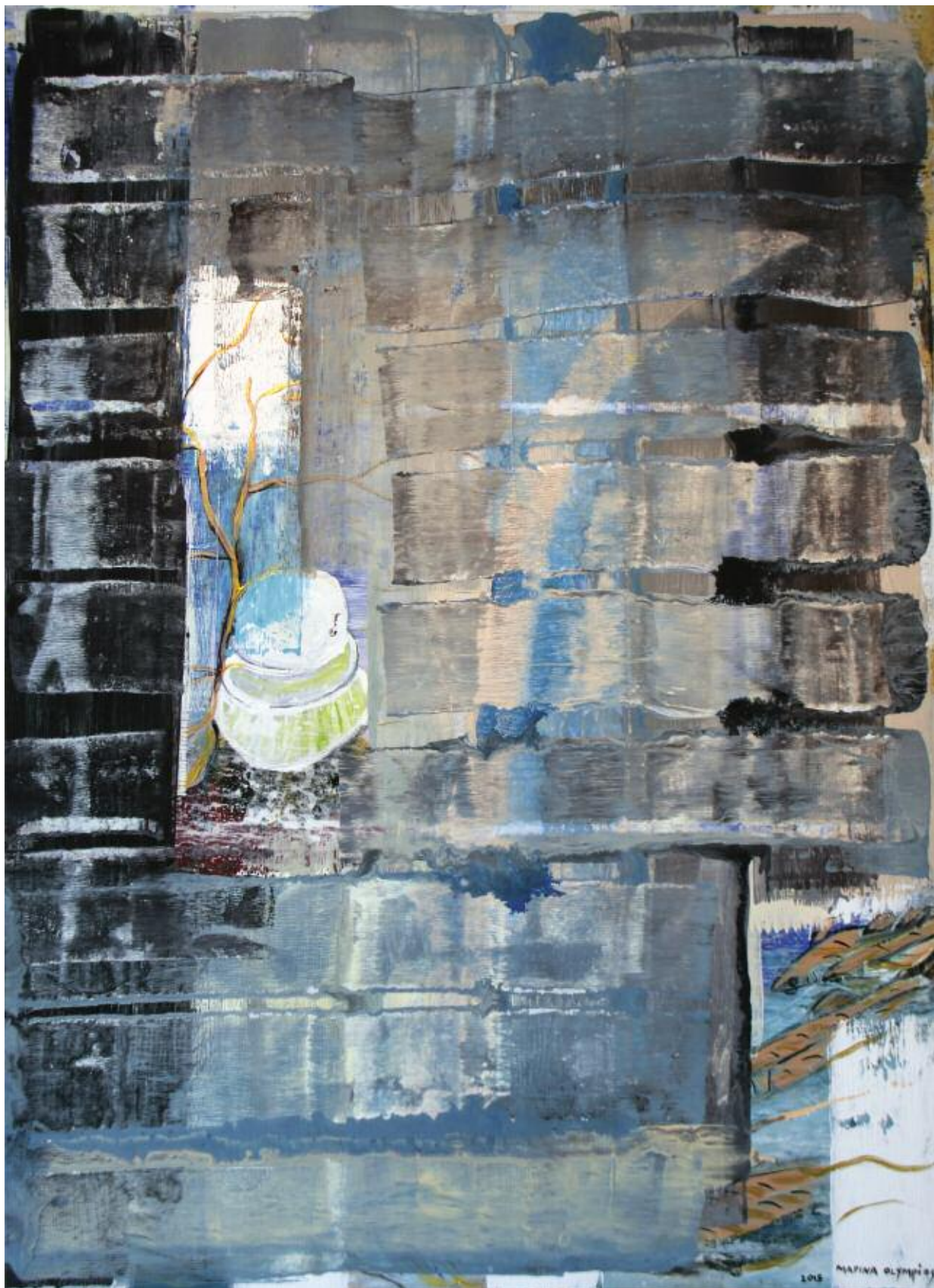
Rusted Descending Trouts 2015 122 x 92 cm, acrylic on canvas