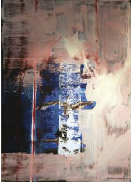
Flying into Burning Skies 2015 83 X 67cm, acrylic on canvas