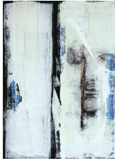
Black and White Face 2015 79 x 53 cm acrylic on canvas