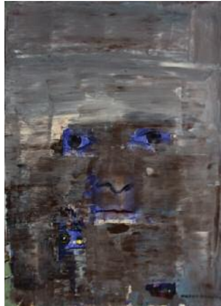
Blue Girl 2015 68 x 57 cm, acrylic on canvas