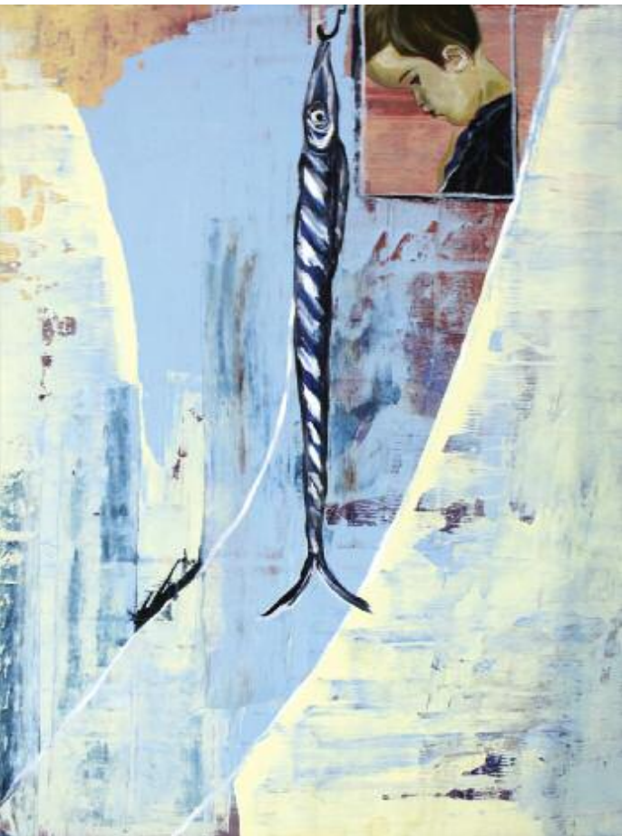
Crying over a Dead Fish 2015 122 x 92 cm, acrylic on canvas