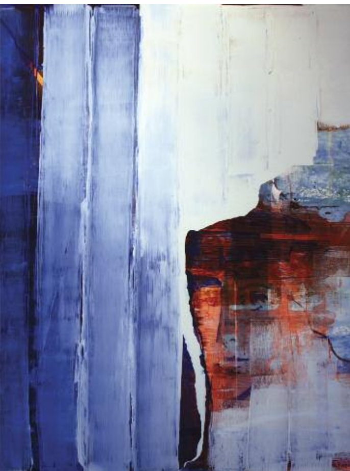
Sunburned. 2015 122 x 102 cm, acrylic on canvas