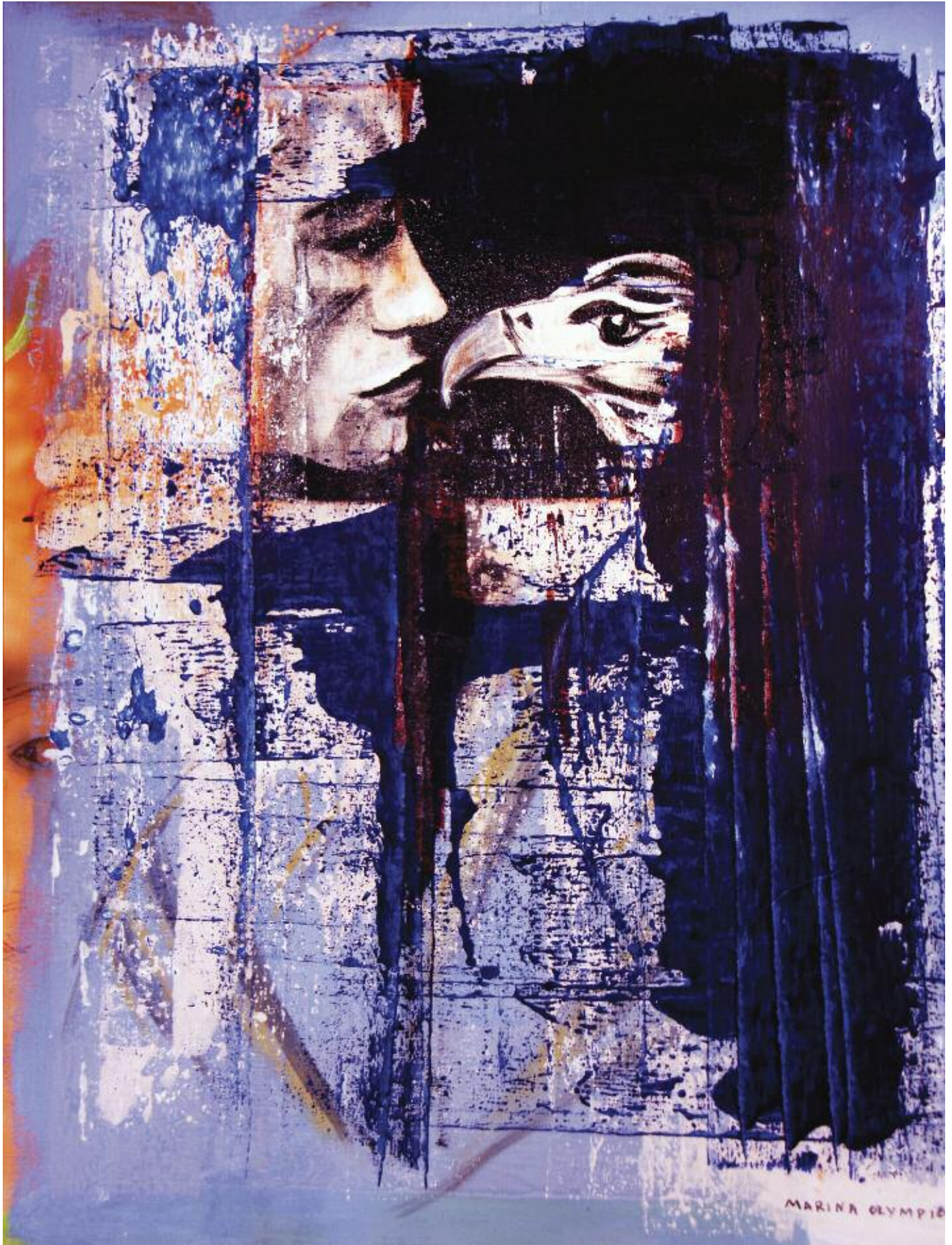
Wild and Yours 2015 100 x 82cm, acrylic on canvas