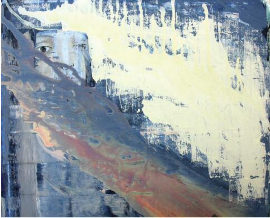
Tears into Time 2015 103 x 103 cm, acrylic on canvas