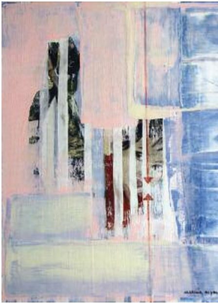
Boy and Soldier 2015 68 x 57 cm acrylic on canvas