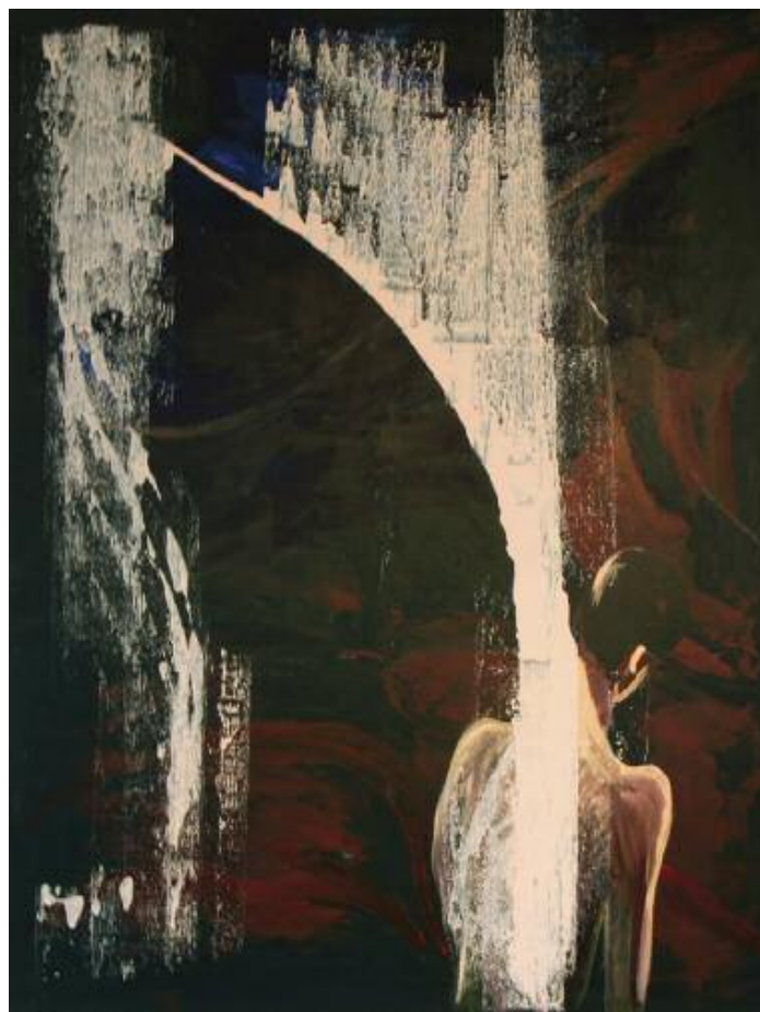
Body Light in Solitude 2015 122 x 102 cm, acrylic on canvas