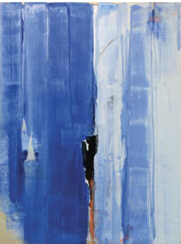
Ink Injection 2015 122 x 102 cm, acrylic on canvas