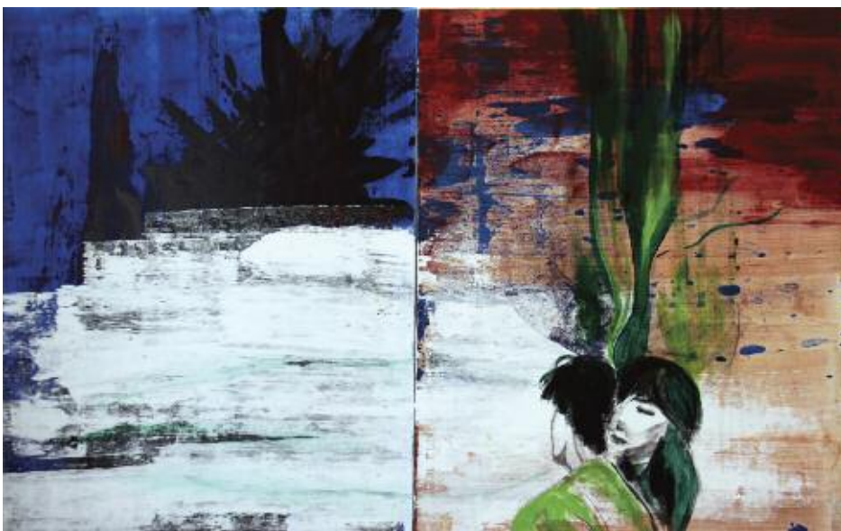
Unfulfilled 2015 2 canvas 94 x 76 cm acrylic on canvas