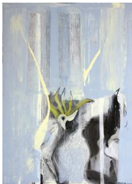
Parrot 2015 75 x 62 cm acrylic on canvas