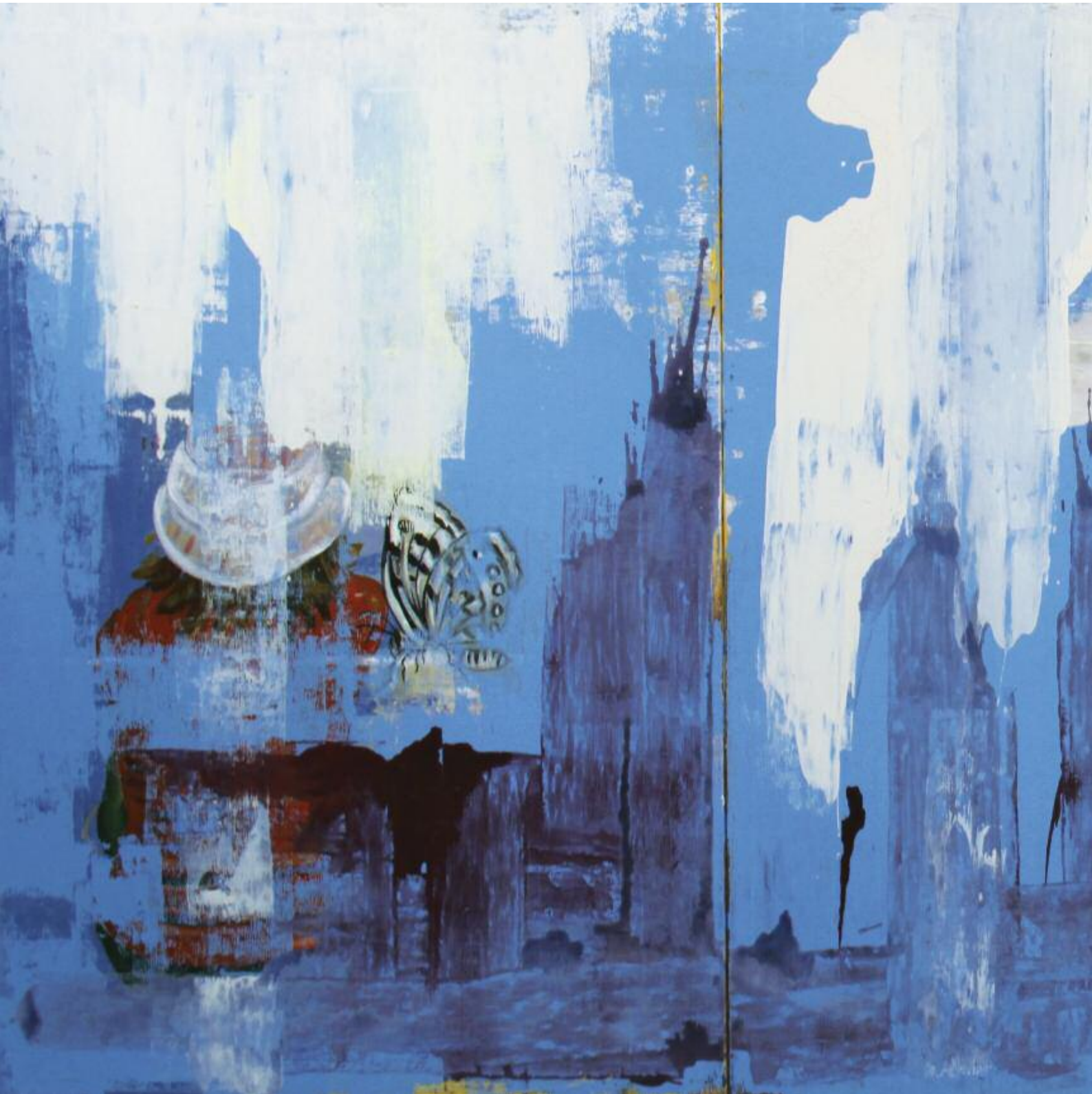
The Battle of the Cello 2014 122 x 274 cm, acrylic on canvas