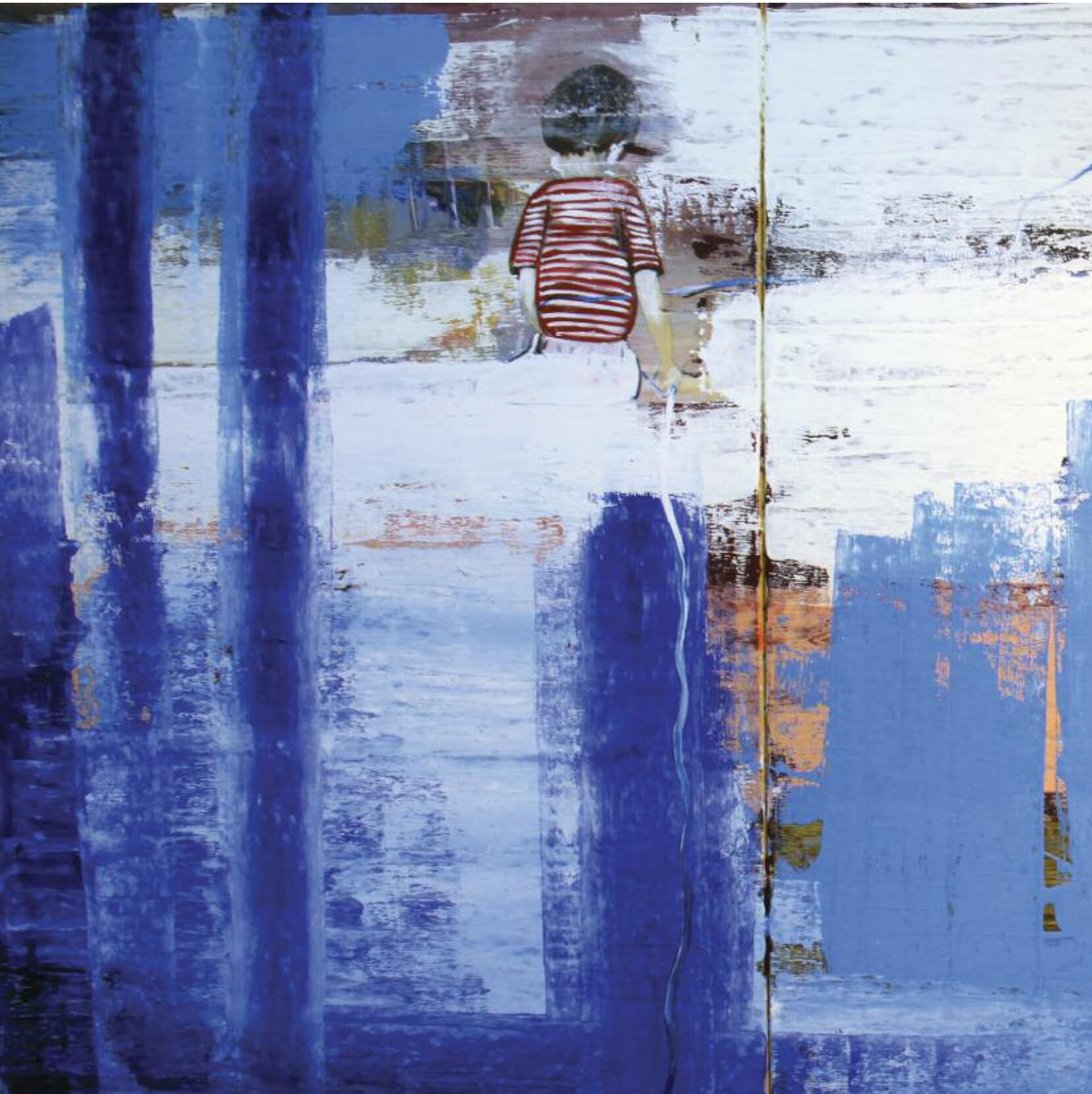
Restraining the Catch 2014 122 x 274 cm, acrylic on canvas