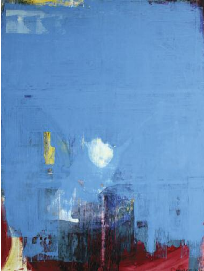
The Hole under the Waves 122 x 102 cm, acrylic on canvas