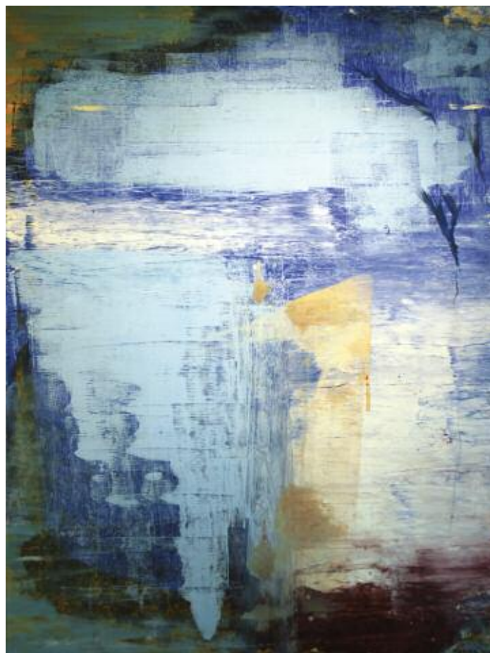
A New Blue Day 2015 122 x 92 cm, acrylic on canvas