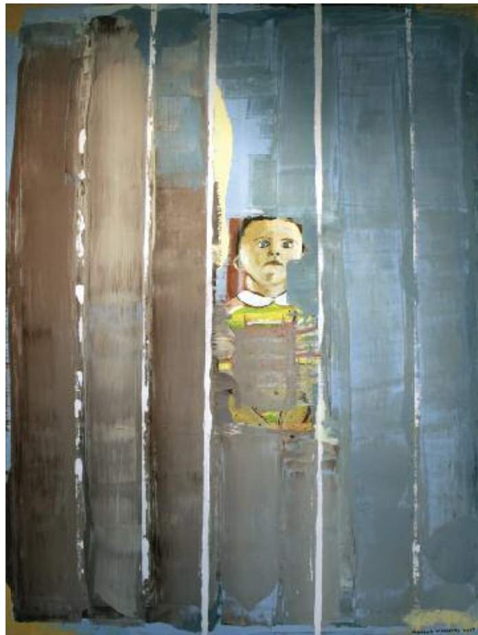
The Enclosure 2015 122 x 92 cm, acrylic on canvas