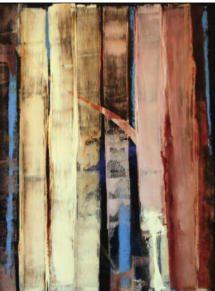
Magic Secret Night 2015 122 x 102 cm, acrylic on canvas