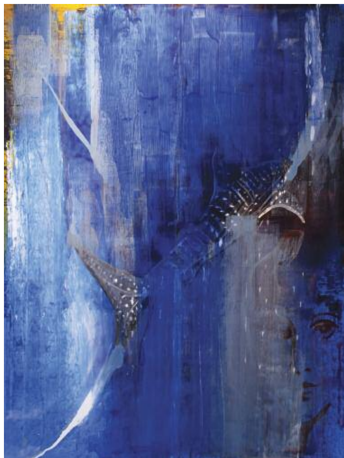
The whale shark Face 2015 122 x 102 cm, acrylic on canvas