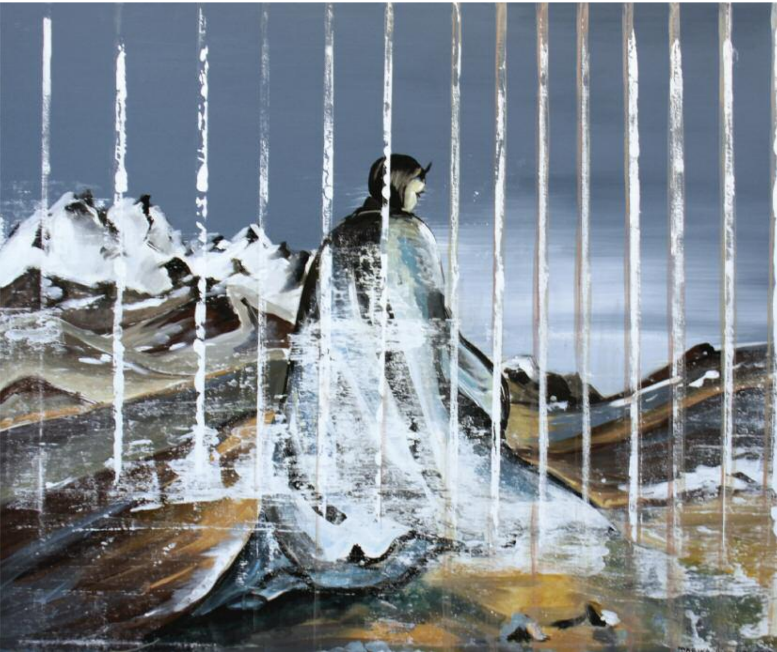
The Snow Girl 2015 102 x 122 cm, acrylic on canvas