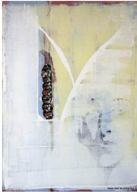
Cocoon on You 2014 82 x 62 cm acrylic on canvas