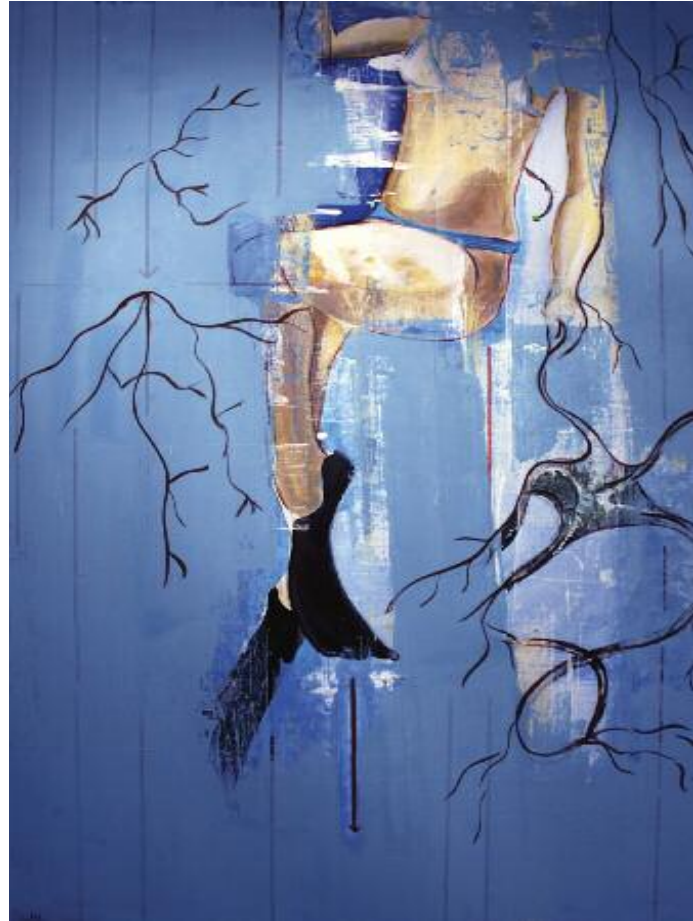
Diving into the Blue 2014 122 x 82 cm, acrylic on canvas