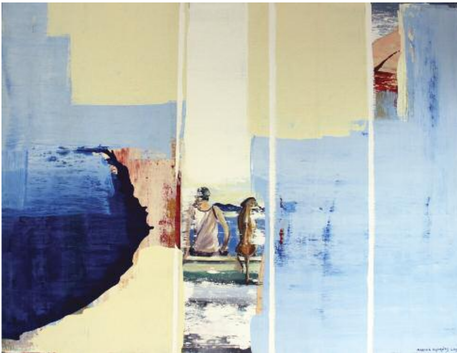
Ulysses never left or How do you Love 2015 92 x 122 cm, acrylic on canvas