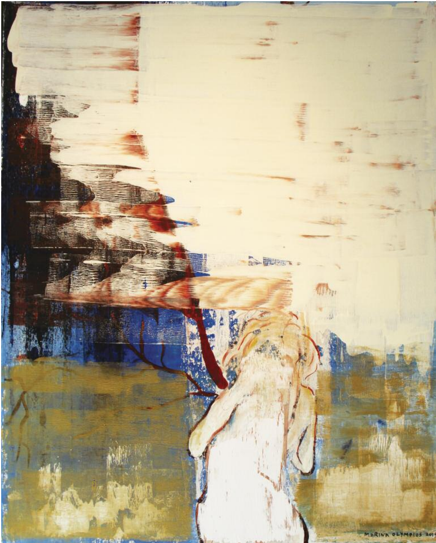
I am the forest 2015 122 x 102cm, acrylic on canvas