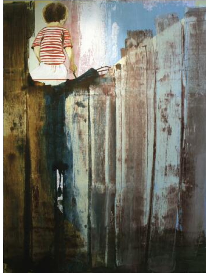
Holding a Thread from Memory 2015 122 x 92 cm, acrylic on canvas