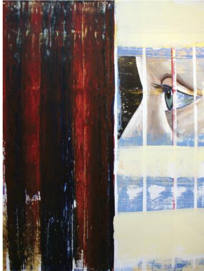
Now I know Me 2015 122 x 102 cm, acrylic on canvas