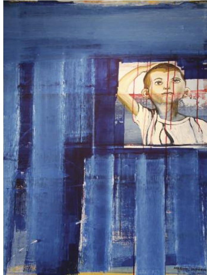
Bleeding Blue 2012 122 x 92 cm, acrylic on canvas