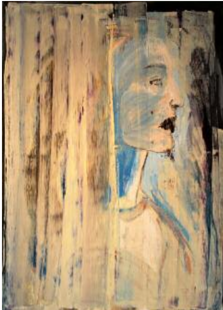
Faded Face of Love 2015 94 x 75 cm, acrylic on canvas