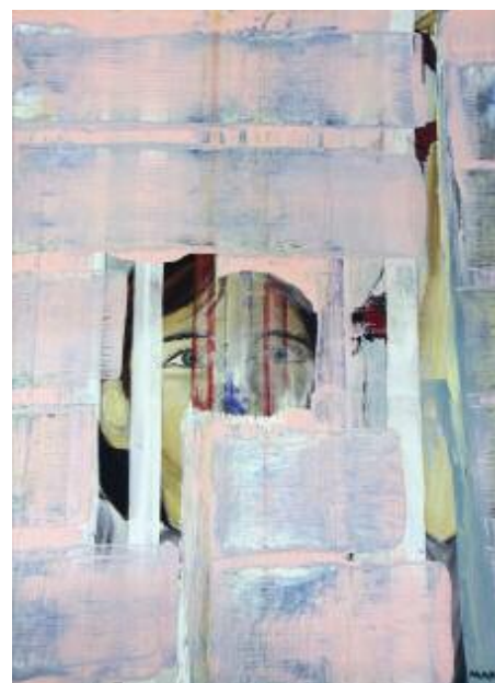
Hanging Hopes 2015 68 x 57 cm acrylic on canvas