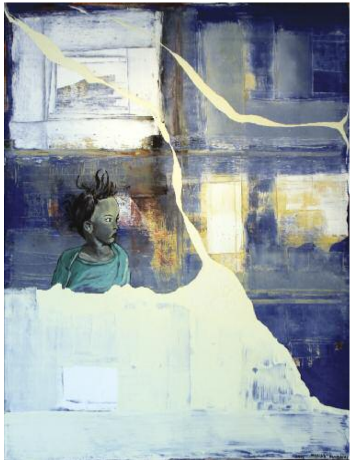
Every day in every way, you hold the light of the world in your hands 2015 122 x 102 cm, acrylic on canvas