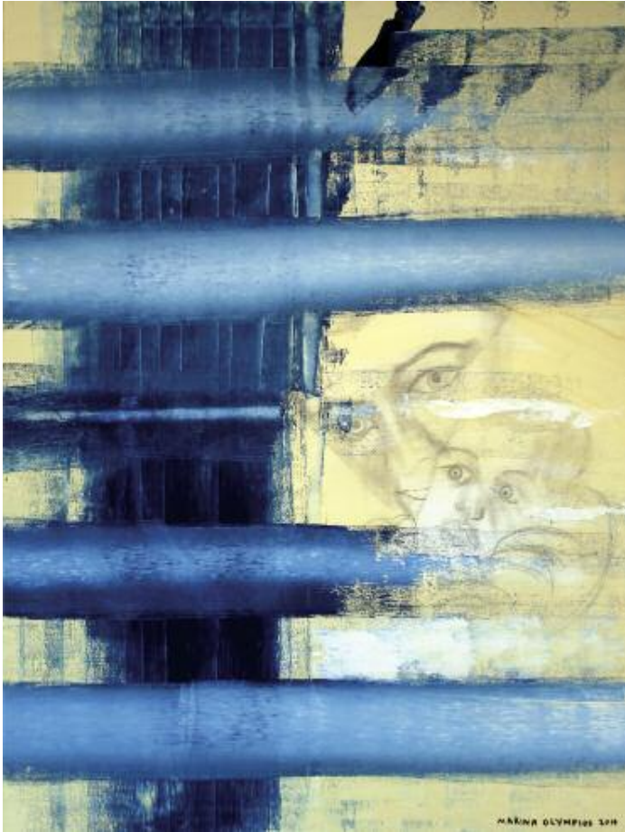
Last Measure or Holding Georges 2014 102 x 82 cm, acrylic on canvas