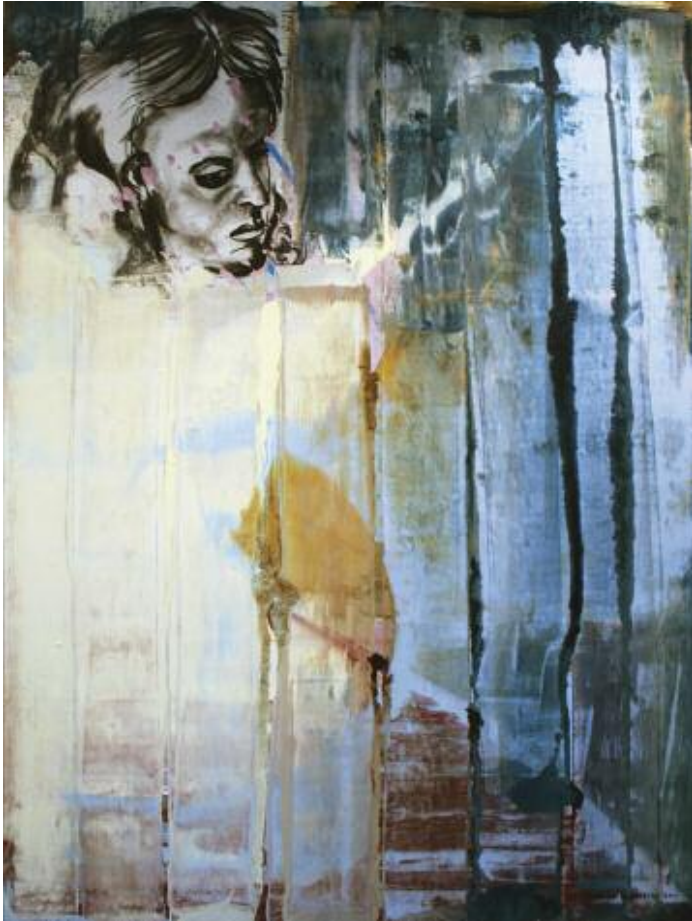
The Tragic Solitude of Life 2015 122 x 92 cm, acrylic on canvas