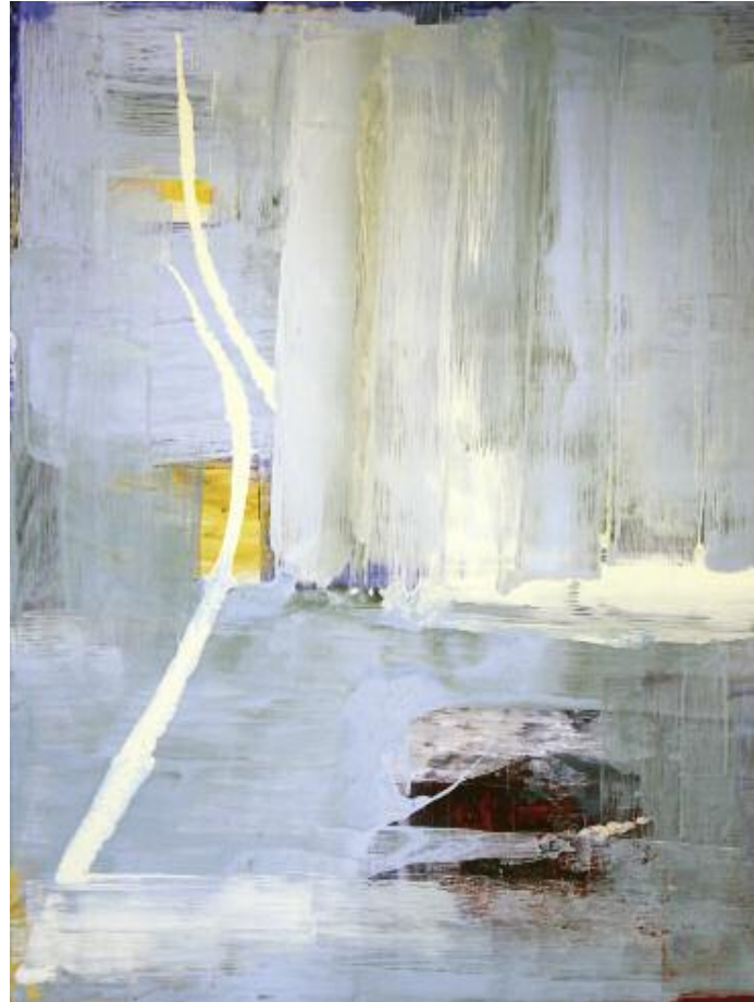
The Sunlight under the Waves 122 x 102 cm, acrylic on canvas