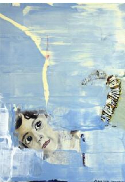
And all begins again 2015 68 x 57 cm acrylic on canvas