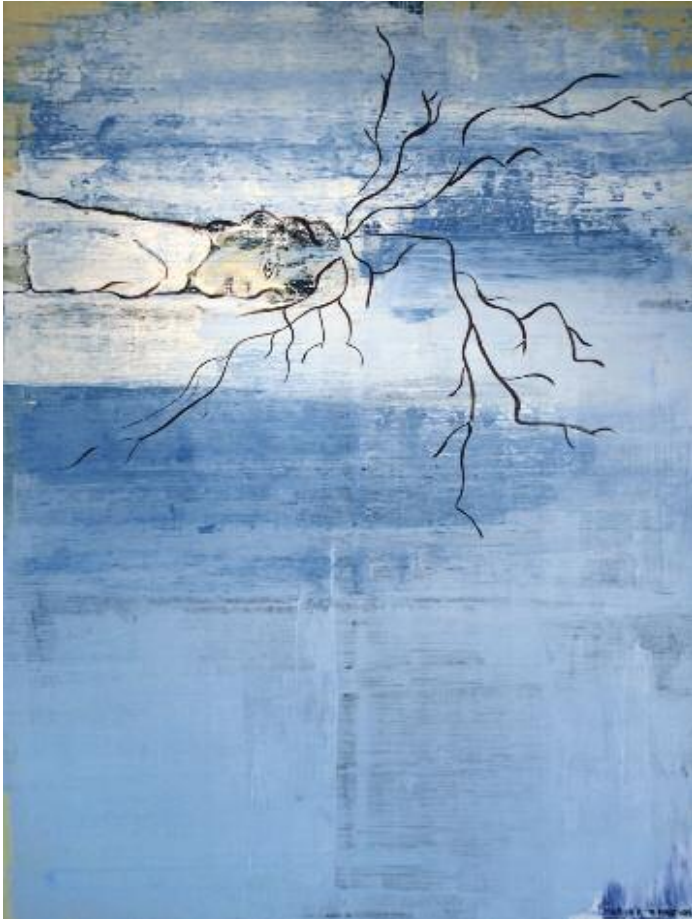
Roots into the Blue Sea 2014 122 x 92 cm, acrylic on canvas