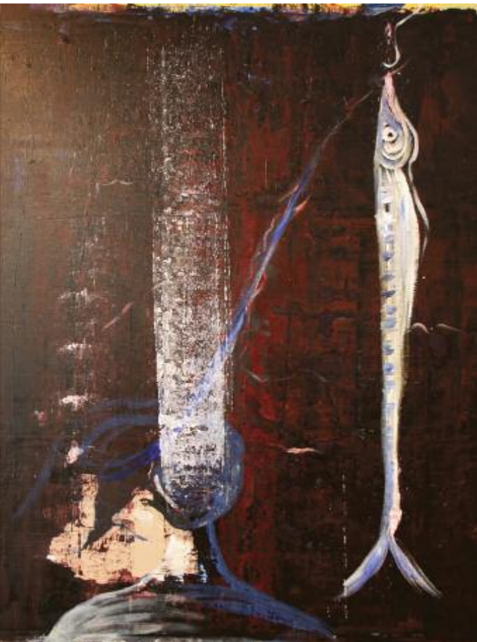
Until you will shine my shoes 2015 122 x 92 cm, acrylic on canvas